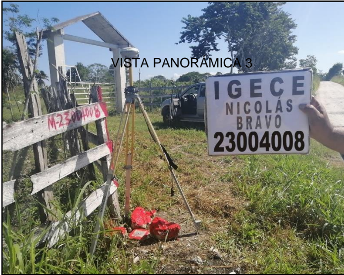
VISTA PANORÁMICA 1