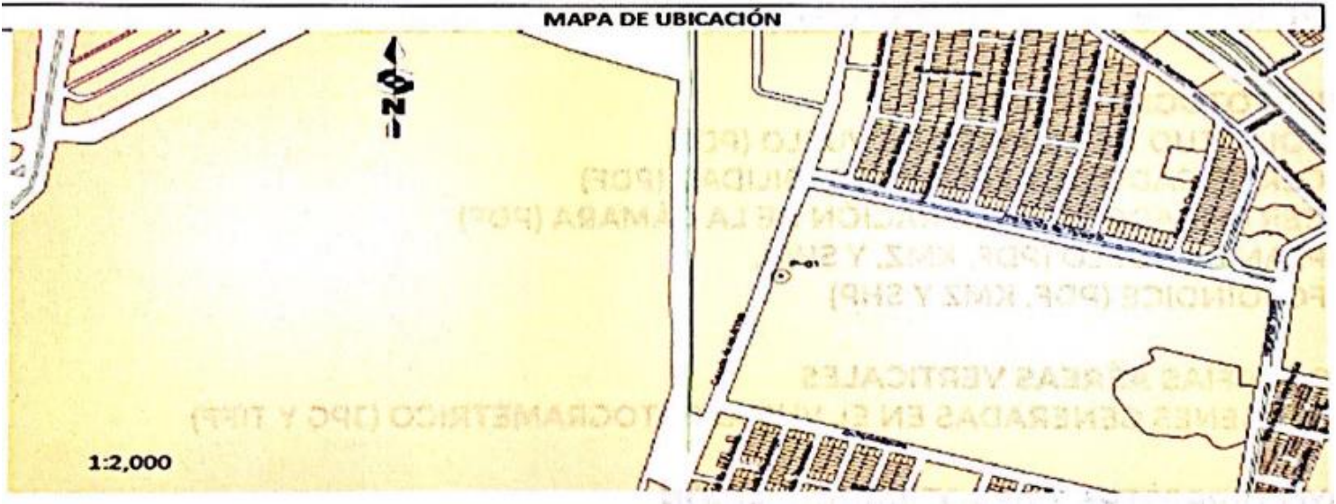
VISTA DE DETALLE FOTO DETALLE