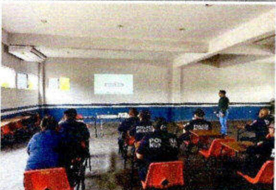
Taller de capacitación "Modelo Nacional de Policía y Justicia Cívica" dirigido a personas servidoras públicas del SSPyTM del municipio de Solidaridad, en la ciudad Playa del Carmen. 23/noviembre/2023.