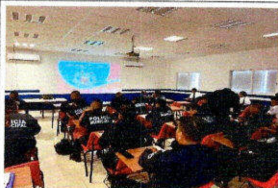
Taller de capacitación "Modelo Nacional de Policía y Justicia Cívica" dirigido a personas servidoras públicas del SSPyTM del municipio de Solidaridad, en la ciudad Playa del Carmen. 27/noviembre/2023.