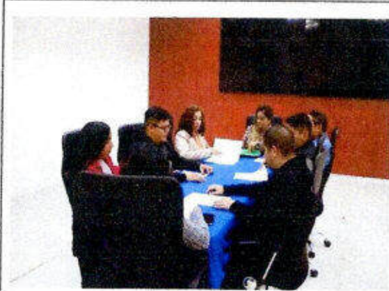
Impartición de la certificación "EC0076 - Evaluación de la competencia de candidatos con base en Estándares de Competencia" dirigido a personas servidoras públicas en la ciudad de Chetumal, Othón P. Blanco. 18-20/diciembre/2023.