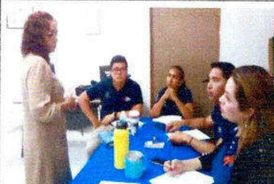
Impartición de la certificación "EC0217.01 - Impartición de cursos de formación del capital humano de manera presencial grupal" dirigido a personas servidoras públicas en la ciudad de Chetumal, Othón P. Blanco. 27/noviembre/2023 - 01/diciembre/2023