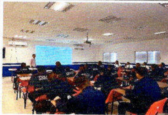
Taller de capacitación "Modelo Nacional de Policía Y Justicia Cívica" dirigido a personas servidoras públicas del SSPyTM del municipio de Solidaridad, en la ciudad Playa del Carmen. 18/noviembre/2023.