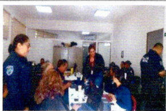
Impartición de la certificación "EC0301 - Diseño de cursos de formación del capital humano de manera presencial grupal, sus instrumentos de evaluación y manuales del curso" dirigido a personas servidoras públicas en la ciudad de Chetumal, Othón P. Blanco. 27/noviembre/2023 - 01/diciembre/2023.