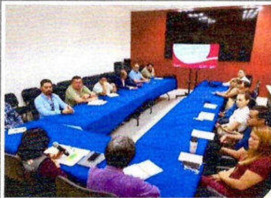
Reunión de seguimiento del "Modelo de Prevención Quintana Roo", dirigido a personas servidoras públicas de instituciones Estatales, llevado a cabo en la ciudad de Chetumal. 06/octubre/2023.