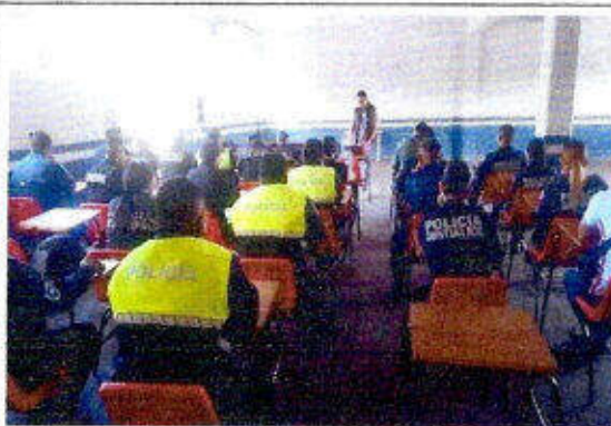
Taller de capacitación "Modelo Nacional de Policía y Justicia Cívica" dirigido a personas servidoras públicas del SSPyTM del municipio de Solidaridad, en la ciudad Playa del Carmen. 07/diciembre/2023.