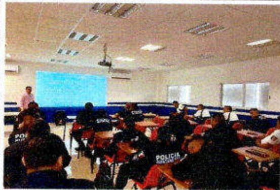
Taller de capacitación "Modelo Nacional de Policía y Justicia Cívica" dirigido a personas servidoras públicas del SSPyTM del municipio de Solidaridad, en la ciudad Playa del Carmen. 27/noviembre/2023.