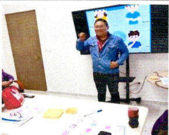
Impartición del curso "Lengua de Señas Mexicana" dirigido a personas servidoras públicas en la ciudad de Chetumal, Othón P. Blanco. 27/noviembre/2023 - 01/diciembre/2023.