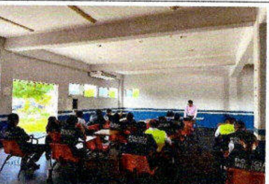
Taller de capacitación "Modelo Nacional de Policía y Justicia Cívica" dirigido a personas servidoras públicas del SSPyTM del municipio de Solidaridad, en la ciudad Playa del Carmen. 24/noviembre/2023.