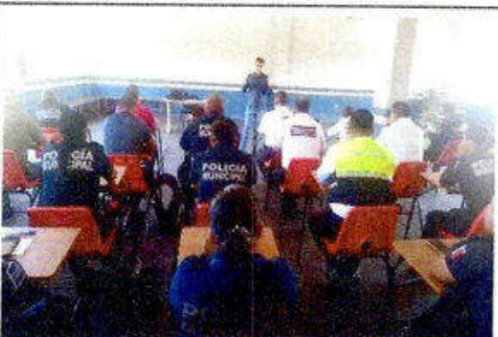
Taller de capacitación "Modelo Nacional de Policía Y Justicia Cívica" dirigido a personas servidoras públicas del SSPyTM del municipio de Solidaridad, en la ciudad Playa del Carmen. 06/diciembre/2023.