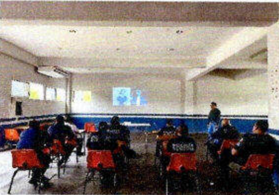
Taller de capacitación "Modelo Nacional de Policía y Justicia Cívica" dirigido a personas servidoras públicas del SSPyTM del municipio de Solidaridad, en la ciudad Playa del Carmen. 23/noviembre/2023.