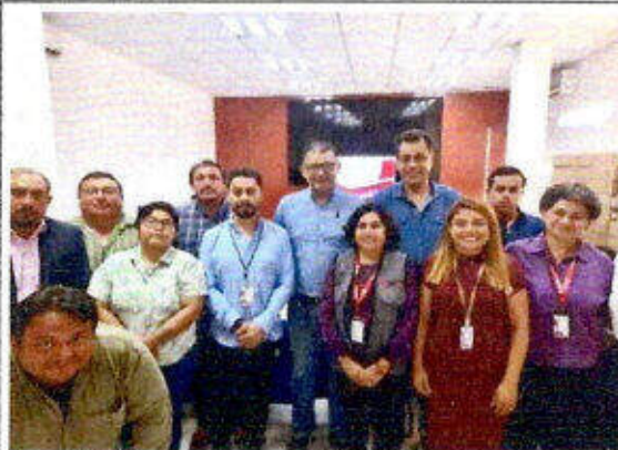
Reunión de seguimiento del "Modelo de Prevención Quintana Roo", dirigido a personas servidoras públicas de instituciones Estatales, llevado a cabo en la ciudad de Chetumal. 06/octubre/2023.