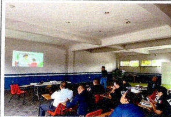
Taller de capacitación "Modelo Nacional de Policía y Justicia Cívica" dirigido a personas servidoras públicas del SSPyTM del municipio de Solidaridad, en la ciudad Playa del Carmen. 26/noviembre/2023.