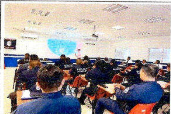
Taller de capacitación "Modelo Nacional de Policía Y Justicia Cívica" dirigido a personas servidoras públicas del SSPyTM del municipio de Solidaridad, en la ciudad Playa del Carmen. 18/noviembre/2023.