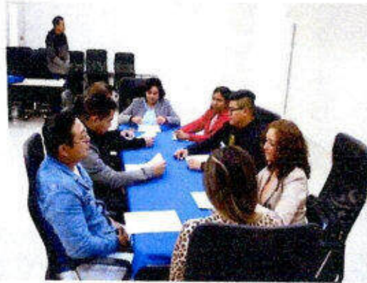
Impartición de la certificación "EC0076 - Evaluación de la competencia de candidatos con base en Estándares de Competencia" dirigido a personas servidoras públicas en la ciudad de Chetumal, Othón P. Blanco. 18-20/diciembre/2023.