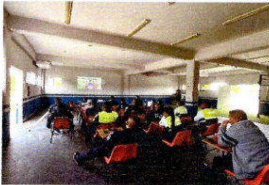
Taller de capacitación "Modelo Nacional de Policía y Justicia Cívica" dirigido a personas servidoras públicas del SSPyTM del municipio de Solidaridad, en la ciudad Playa del Carmen. 22/noviembre/2023.