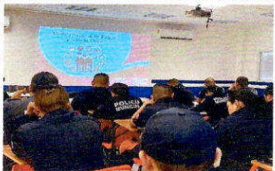
Taller de capacitación "Modelo Nacional de Policía y Justicia Cívica" dirigido a personas servidoras públicas del SSPyTM del municipio de Solidaridad, en la ciudad Playa del Carmen. 17/noviembre/2023.