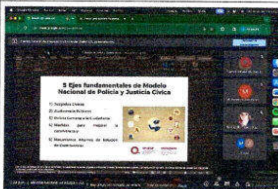
Taller de capacitación modo virtual "Modelo Nacional de Policía y Justicia Cívica" dirigido a personas servidoras públicas del SSPyTM del municipio de Othón P. Blanco, en la ciudad de Chetumal. 20/diciembre/2023.