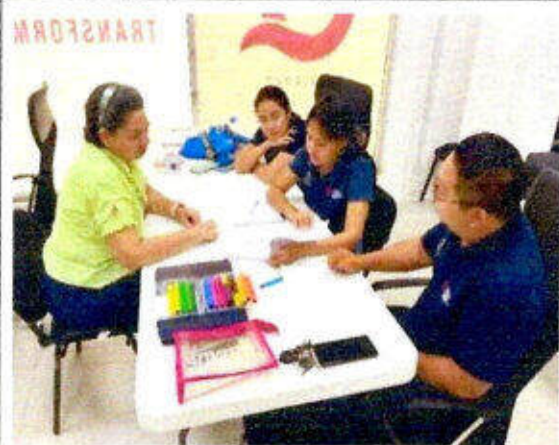
Impartición del curso "Lengua de Señas Mexicana" dirigido a personas servidoras públicas en la ciudad de Chetumal, Othón P. Blanco. 27/noviembre/2023 - 01/diciembre/2023.