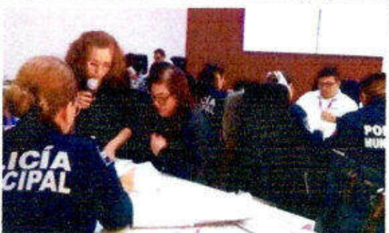
Impartición de la certificación "EC1038 - Intervención para la solución de conflictos" dirigido a personas servidoras públicas en la ciudad de Chetumal, Othón P. Blanco. 11-13/diciembre/2023.