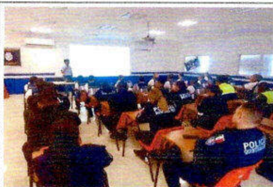
Taller de capacitación "Modelo Nacional de Policía y Justicia Cívica" dirigido a personas servidoras públicas del SSPyTM del municipio de Solidaridad, en la ciudad Playa del Carmen. 16/noviembre/2023.