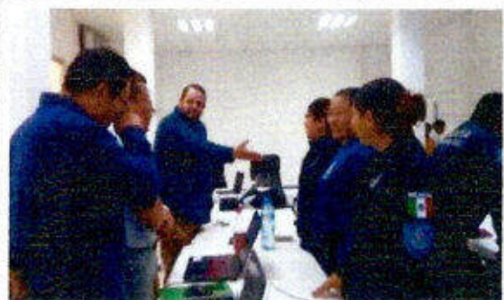
Impartición de la certificación "EC1038 - Intervención para la solución de conflictos" dirigido a personas servidoras públicas en la ciudad de Chetumal, Othón P. Blanco. 11-13/diciembre/2023.