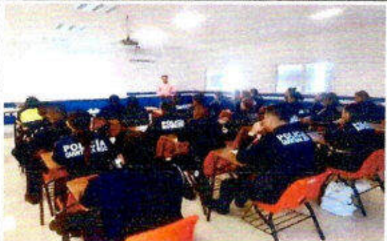
Taller de capacitación "Modelo Nacional de Policía y Justicia Cívica" dirigido a personas servidoras públicas del SSPyTM del municipio de Solidaridad, en la ciudad Playa del Carmen. 17/noviembre/2023.