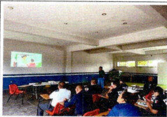
Taller de capacitación "Modelo Nacional de Policía y Justicia Cívica" dirigido a personas servidoras públicas del SSPyTM del municipio de Solidaridad, en la ciudad Playa del Carmen. 26/noviembre/2023.