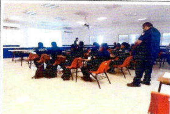
Taller de capacitación "Modelo Nacional de Policía Y Justicia Cívica" dirigido a personas servidoras públicas del SSPyTM del municipio de Solidaridad, en la ciudad Playa del Carmen. 20/noviembre/2023.