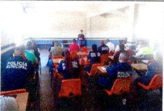
Taller de capacitación "Modelo Nacional de Policía Y Justicia Cívica" dirigido a personas servidoras públicas del SSPyTM del municipio de Solidaridad, en la ciudad Playa del Carmen. 06/diciembre/2023.