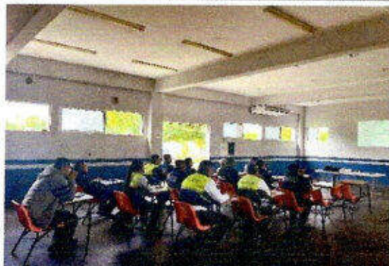
Taller de capacitación "Modelo Nacional de Policía y Justicia Cívica" dirigido a personas servidoras públicas del SSPyTM del municipio de Solidaridad, en la ciudad Playa del Carmen. 22/noviembre/2023.