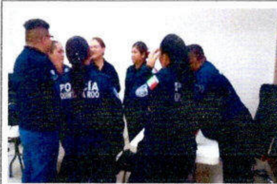
Impartición de la certificación "EC0301 - Diseño de cursos de formación del capital humano de manera presencial grupal, sus instrumentos de evaluación y manuales del curso" dirigido a personas servidoras públicas en la ciudad de Chetumal, Othón P. Blanco. 27/noviembre/2023 - 01/diciembre/2023.