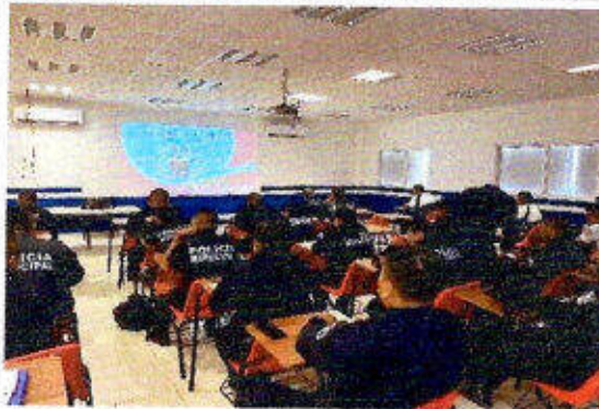
Taller de capacitación "Modelo Nacional de Policía Y Justicia Cívica" dirigido a personas servidoras públicas del SSPyTM del municipio de Solidaridad, en la ciudad Playa del Carmen. 20/noviembre/2023.