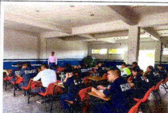
Taller de capacitación "Modelo Nacional de Policía Y Justicia Cívica" dirigido a personas servidoras públicas del SSPyTM del municipio de Solidaridad, en la ciudad Playa del Carmen. 21/noviembre/2023.