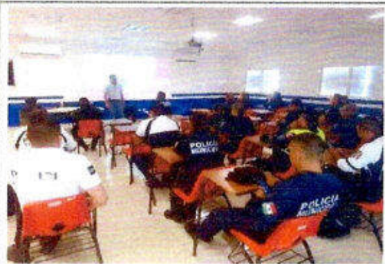
Taller de capacitación "Modelo Nacional de Policía y Justicia Cívica" dirigido a personas servidoras públicas del SSPyTM del municipio de Solidaridad, en la ciudad Playa del Carmen. 16/noviembre/2023.