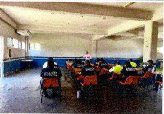
Taller de capacitación "Modelo Nacional de Policía y Justicia Cívica" dirigido a personas servidoras públicas del SSPyTM del municipio de Solidaridad, en la ciudad Playa del Carmen. 24/noviembre/2023.