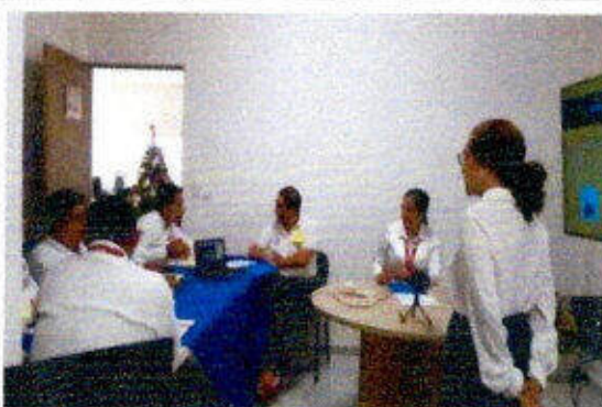
Impartición de la certificación "EC0217.01 - Impartición de cursos de formación del capital humano de manera presencial grupal" dirigido a personas servidoras públicas en la ciudad de Chetumal, Othón P. Blanco. 27/noviembre/2023 - 01/diciembre/2023