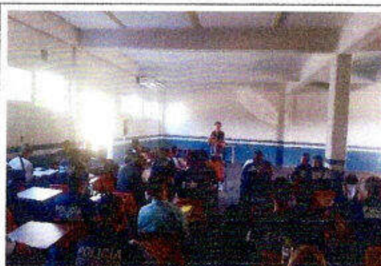
Taller de capacitación "Modelo Nacional de Policía y Justicia Cívica" dirigido a personas servidoras públicas del SSPyTM del municipio de Solidaridad, en la ciudad Playa del Carmen. 07/diciembre/2023.