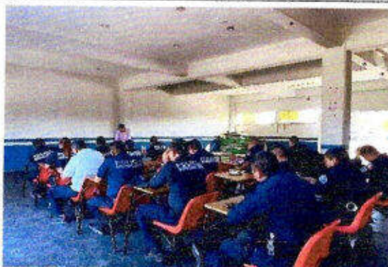
Taller de capacitación "Modelo Nacional de Policía Y Justicia Cívica" dirigido a personas servidoras públicas del SSPyTM del municipio de Solidaridad, en la ciudad Playa del Carmen. 21/noviembre/2023.