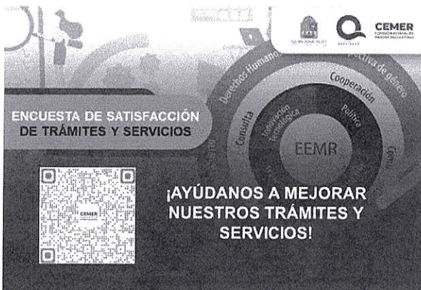
Imagen 1 Encuesta de satisfacción de trámites y servicios.

Descripción: La meta anual del componente es de 300 encuestas aplicadas a la ciudadanía en materia de trámites y servicios de las cuales 194 encuestas se esperan sean satisfactorias. En ese sentido, para el segundo trimestre comprendido de abril a junio del año 2023, se aplicaron 381 encuestas de opinión pública de las cuales 241 encuestas son consideradas satisfactorias al manifestarse que el trato recibido en el otorgamiento del trámite o servicio fue bueno o excelente, lo que representa el 102% en el cumplimiento del indicador.