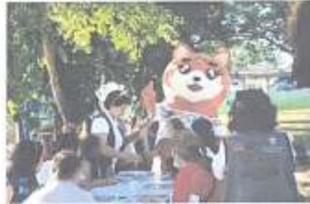
Ilustración 3 Cine Móvil 11/01/2023