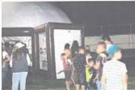
Ilustración 1 Cine Móvil 05/01/2023