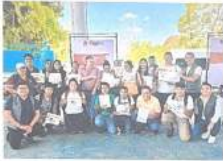
Ilustración 6 Caravana del Bienestar en la comunidad de Pucte 28/03/2023