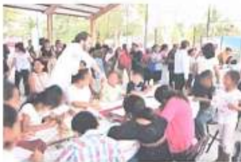
Ilustración 5 Caravana del Bienestar en la comunidad de Nicolás Bravo 15/03/2023

Se llevaron a cabo 2 Caravanas del bienestar en coordinación con la Secretaría del Bienestar para acercar a las comunidades los servicios y actividades del Gobierno del Estado para el público en general y atender los factores de riesgo sociales, situacionales y económicos de las personas del Estado.