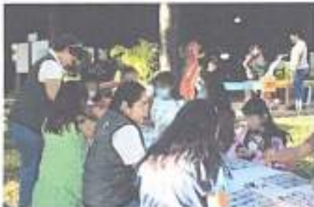
Ilustración 4 Cine móvil 11/01/2023