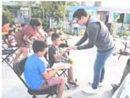
Ilustración 7 Cine en Colonia en Puerto Morelos 17/03/2023

Se realizo un Cine en Colonia en el municipio de Puerto Morelos dirigido al publico en general con el objetivo de reconstruir el tejido social y atender factores de riesgos situacionales.