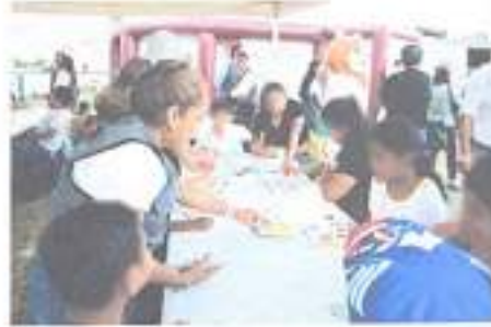
Ilustración 2 Cine Móvil 05/01/2023