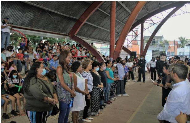
EVENTO PROTOCOLARIO Conformación de Red Benito Juárez