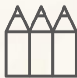
LÁPICES DE COLORES