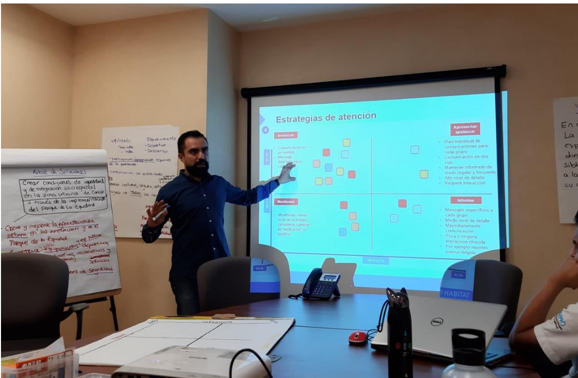
Imagen 6. Dinámica del mapeo de actores.