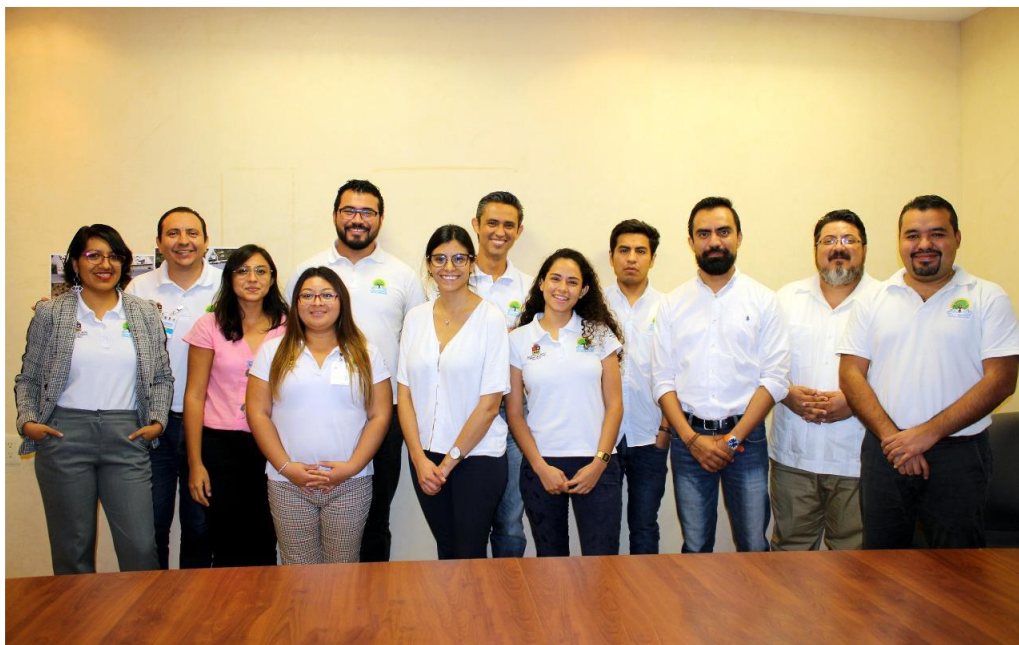
Imagen 1. Integrantes del taller realizado el 28 de noviembre de 2019.

“La colaboración entre los dos organismos se rige mediante la asistencia técnica, análisis de campo, participación ciudadana, entre otros, que coadyuvan a un mejor entendimiento y alineación de trabajo desde la perspectiva de ordenamiento territorial”.