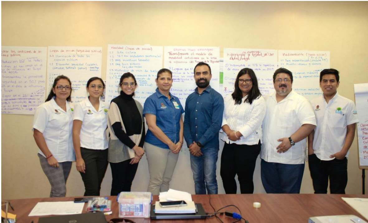
Imagen 5. Resultados de las líneas estratégicas y los indicadores para el monitoreo del proyecto del Parque de la Equidad.

En consecuencia de la propuesta realizada del objetivo central y la visión, se realizaron una serie de lineamientos estratégicos, y que a su vez construyó una serie de objetivos para su alcance. Otra de las acciones realizadas durante las sesiones a finales del mes de enero de 2020, fueron el mapeo de los actores involucrados y la clasificación de los posibles riesgos según el alto y bajo impacto entre otras características para su categorización.