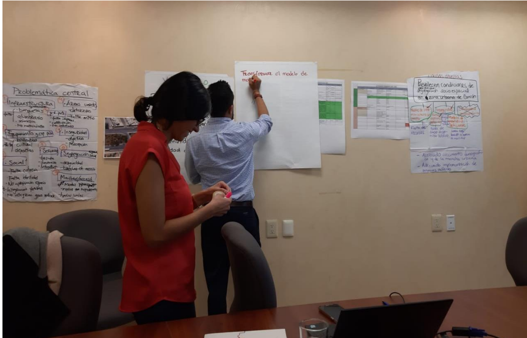
Imagen 2. Lluvia de ideas realizada por los integrantes de la AGEPRO para generar las problemáticas principales alrededor de la zona de influencia del proyecto.

En las sesiones realizadas el 20 y 21 de enero de 2020 se retomó la problemática central y sus causas para poder identificar el objetivo y la visión que se pretende lograr para el proyecto del Parque de la Equidad.