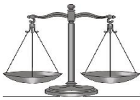
Tabla 6: Implementación de la Perspectiva de Género