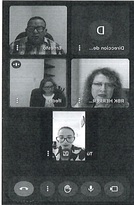
Reunión de trabajo entre la Subsecretaría de Derechos y la Dirección de Capacitación, Formación, Promoción y Difusión en Derechos Humanos de la CDHEQROO