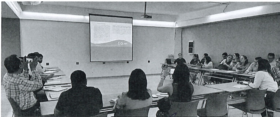
Reunión de Trabajo de la Comisión Interinstitucional Contra los Delitos en Materia de Trata de Personas del Estado de Quintana Roo en el marco de las Jornadas contra la Trata de Personas.

Oficio de invitación a la Secretaría de Turismo para participar en la Convocatoria Pública