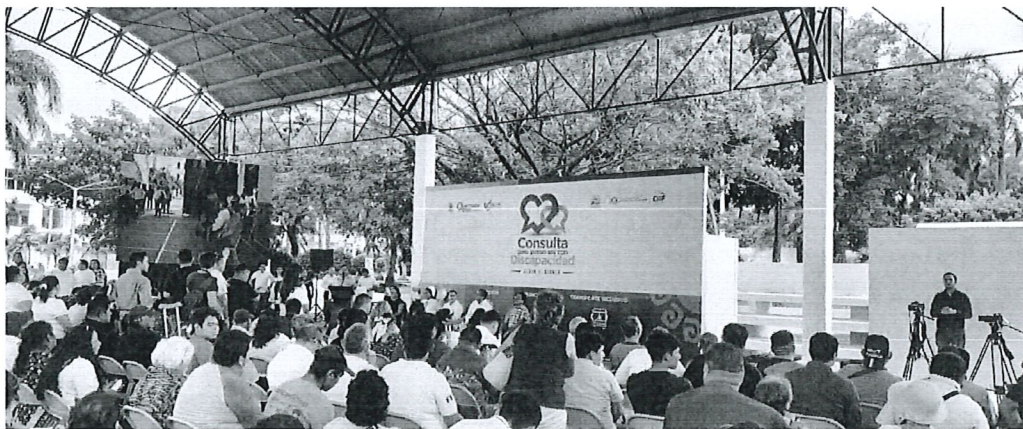
Consulta pública, abierta y regular, estrecha, libre e informada a personas con discapacidad en materia de sus derechos, transporte inclusivo y turismo inclusivo.

Tipo de Evidencia: Fotográfica y Capturas de imagen.