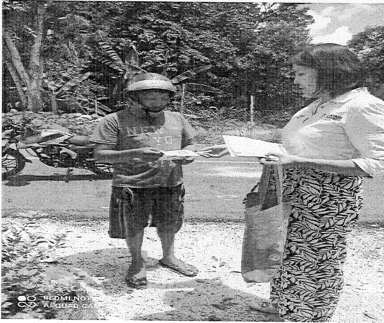
Agosto 2024, Entrega de volantes en lengua Maya