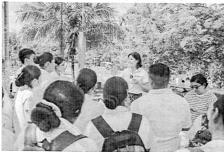
Septiembre 2024, Colocación del Stand Informativo