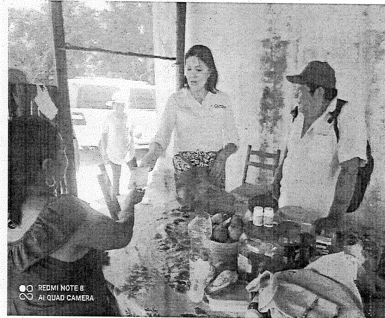
Septiembre 2024, Entrega de volantes en lengua Maya