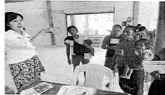
Julio 2024, Instalación de Stand informativo en la comunidad de Palmar