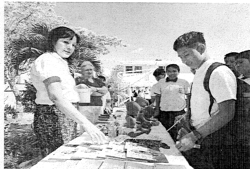
Septiembre 2024, Colocación del Stand Informativo