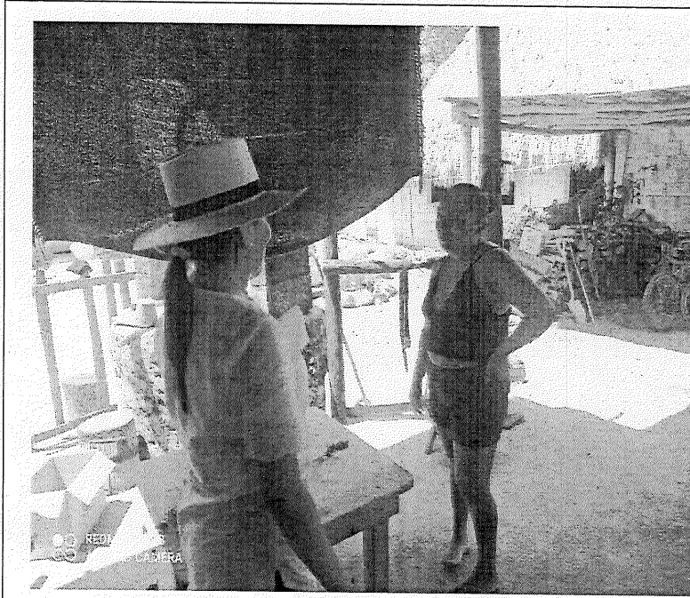
Septiembre 2024, Entrega de volantes en lengua Maya