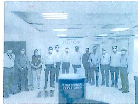
Instalación del programa Piloto "Amigos de México" 17-dic-21

De igual manera, por indicaciones del C. Secretario de Gobierno se asistió a 6 eventos en su Representación.