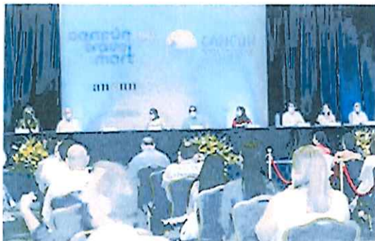
En Representación del Secretario de Gobierno se asistió a la Inauguración del Cancún Travel Mart 18-OCT-2021

En el cuarto Trimestre, se realizaron 12 Sesiones y Reuniones Virtuales.