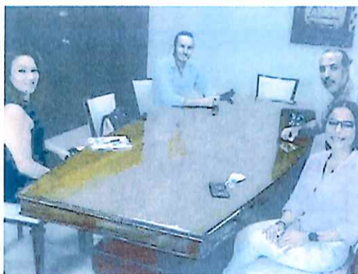
Reunión con Integrantes de la Cooperativa Turística de Xcalak 26-Oct-21

En el Cuarto y último Trimestre de 2021 en la Subsecretaría de Enlace Interinstitucional se realizaron 26 reuniones institucionales con representantes de dependencias de los tres niveles de Gobierno, así como de la propia Secretaría de Gobierno, con la finalidad de brindar atención de manera real, oportuna y solidaria con la ciudadanía.