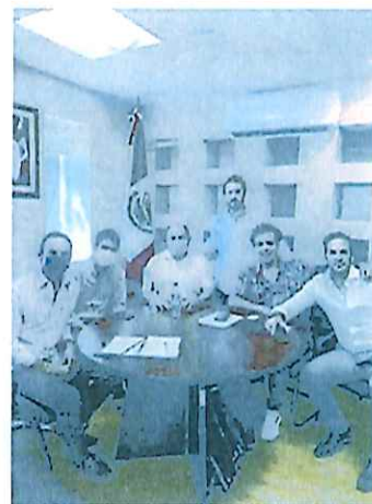
Reunión de inversionistas con el Secretario de Turismo y el Director del Consejo de promoción 12-oct-21