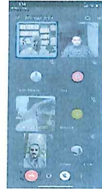
Reunión virtual del H. Comité de Operaciones de APIQROO 17-DIC-21

En el cuarto Trimestre, se realizaron 12 Sesiones y Reuniones Virtuales.