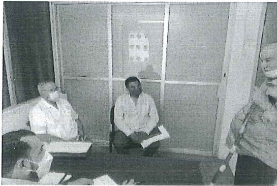
ATENCIÓN A MINISTROS DE CULTO 28-JUL-2022

En el Tercer Trimestre (del 1ro. de julio y hasta el 23 de septiembre) del 2022, en la Subsecretaría de Enlace Interinstitucional, se atendieron a 26 representantes de las organizaciones de la sociedad civil y los grupos religiosos con asesorías de manera presencial, vía electrónica y telefónica