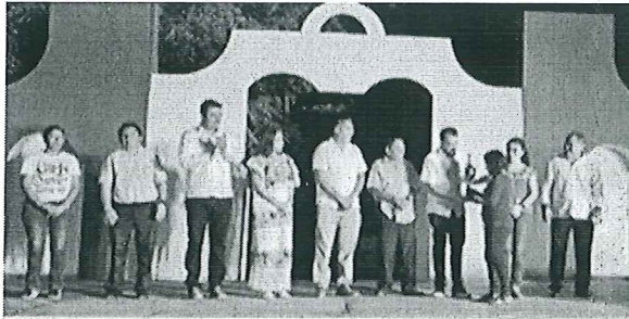
ANIVERSARIO GUERRA SOCIAL MAYA 30-JUL-2022

En el Tercer Trimestre, se realizaron 23 Sesiones y Reuniones Virtuales.