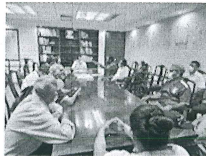
REUNIÓN CON HABITANTES DE LA LOCALIDA DE GUILLERMO PRIETO 31-AGO-2022

En el período que se informa, el Subsecretario de Enlace Interinstitucional sostuvo 6 audiencias.