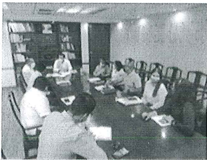
REUNIÓN PREVIA ATENCIÓN SITEQROO 29-JUL-2022

En el Tercer Trimestre (del 1ro. de julio y hasta el 23 de septiembre) de 2022, se realizaron 38 reuniones institucionales con representantes de dependencias de los tres niveles de Gobierno, así como de la propia Secretaría de Gobierno, con la finalidad de brindar atención de manera real, oportuna y solidaria con la ciudadanía.