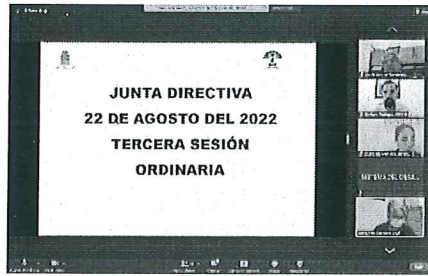
3RA. SESIÓN ORD. DE LA H. JUNTA DIRECTIVA DEL DIF 22-AGO-2022