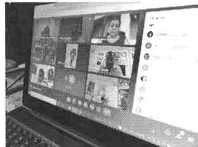
06/09/2021 Reunión con titulares de dependencias del Estado.