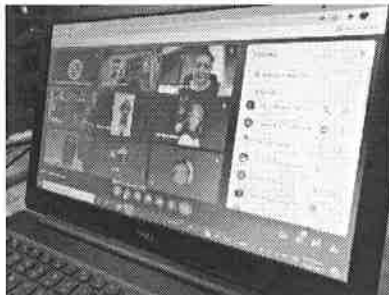
06/09/2021 Reunión con titulares de dependencias del Estado.

Adicionalmente se realizan reuniones de seguimiento en acciones que las dependencias estatales realizan para contención de personal que atiende casos de violencia de género.