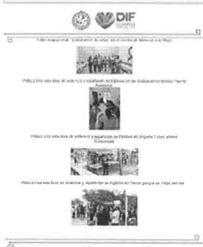
Ejemplo de informe de capacitación del municipio de Cozumel.