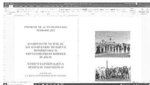
Ejemplo de informe de capacitación del municipio de Othón P. Blanco