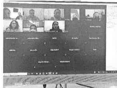
10/02/2022 Capacitación a enlaces de Solidaridad