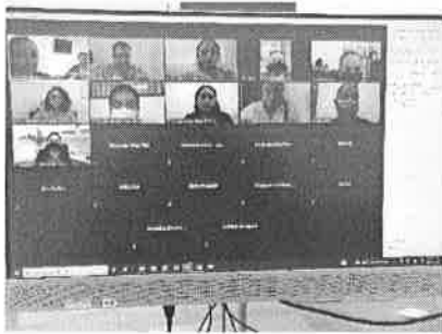
10/02/2022 Capacitación a enlaces de Solidaridad

Se realiza la verificación de acuerdo a la información de los enlaces de las dependencias y ayuntamientos de las acciones realizadas a través del informe del mecanismo de Alerta de Violencia de Género contra las Mujeres en el cual mencionan las actividades en beneficio de las mujeres en condición de violencia, con base en esta información se analiza las posibilidades de replicar las actividades en los diferentes ayuntamientos, asimismo, se generan estrategias para potenciar las capacitaciones.