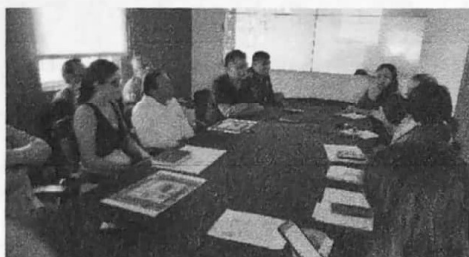
07/11/2022 Reunión OSC y Ayuntamiento de Benito Juárez "Proyecto de recuperación de espacio público".

Se realiza la vinculación con ayuntamientos para indicar las medidas para atender la alerta de violencia de género contra mujeres, dentro de la cual se incluye la recuperación de espacios públicos y en este apartado se especifica la verificación de venta de bebidas alcohólicas, por lo cual se realizó la gestión con estos organismos para que se incluya en el informe de actividades de la alerta.