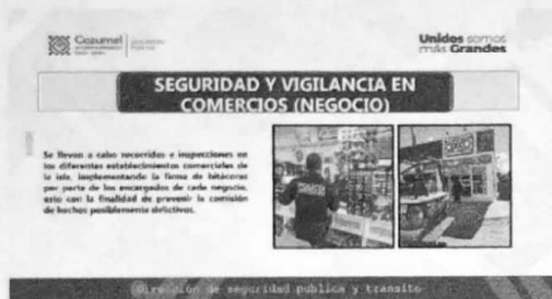
11/2022 Evidencia de verificación por parte de autoridades municipales operativos preventivos.

Se verifica mediante los informes periódicos de cumplimiento de la alerta de violencia de género las acciones que los ayuntamientos realizan como parte de patrullajes y verificación en los comercios para que los establecimientos cumplan con lo establecido en la normativa de venta de bebidas alcohólicas.