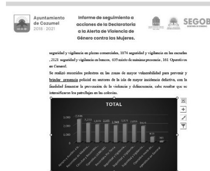
22/06/2022 Evidencia de verificación por parte de autoridades municipales de comercios.

Como resultado se continúa informando de manera periódica por parte de los ayuntamientos el cumplimiento de patrullajes y verificación a comercios para el cumplimiento del reglamento de venta de bebidas alcohólicas, sobre todo en las áreas con mayores índices de violencia.