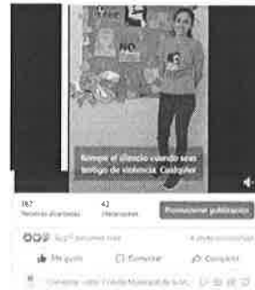
25/03/2022 Verificación de campañas en el municipio de Cozumel.