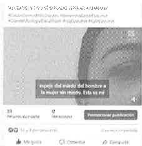
25/03/2022 Verificación de campañas en el municipio de Cozumel.