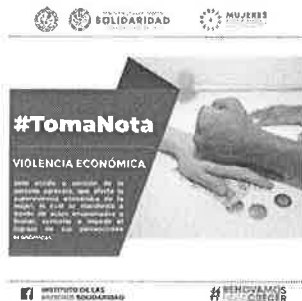
25/03/2022 Verificación de campañas en el municipio de Solidaridad.