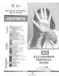
08/03/2022 Verificación de campañas en el municipio de Benito Juárez.