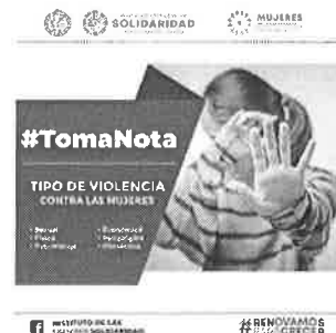
25/03/2022 Verificación de campañas en el municipio de Solidaridad.