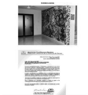
25/06/2022 Verificación de campañas en el municipio de Solidaridad.