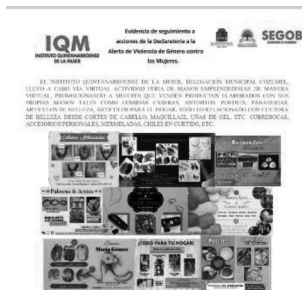
25/06/2022 Verificación de campañas en el municipio de Cozumel.