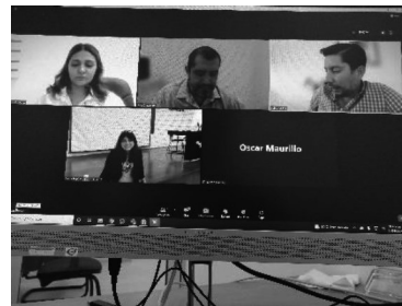
01/04/2022 Reunión de seguimiento con CGC sobre plan de campaña.