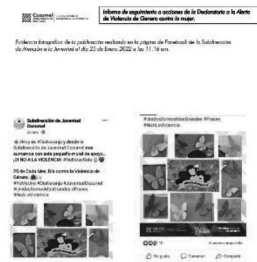
25/06/2022 Verificación de campañas en el municipio de Cozumel.