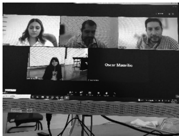
01/04/2022 Reunión de seguimiento con CGC sobre plan de campaña.

Mediante los informes emitidos por los municipios se verifica la implementación de campañas de prevención de la violencia, así como, se revisa la publicación en páginas oficiales sobre atención a la violencia de género, mismas que se revisan con los organismos responsables.