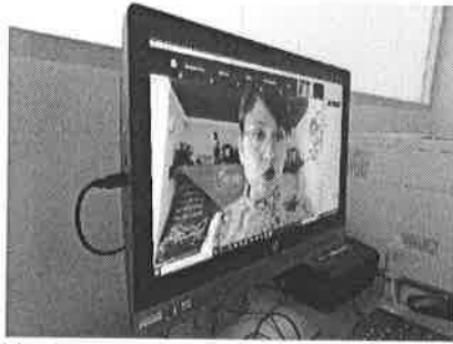
16/02/2021 Reunión de Gobernador con OSCs.

Dentro de los acuerdos generados en la reunión con organismos de la sociedad civil, las campañas que se realizan con las dependencias y organismos involucrados en difundirlas o realizarlas requieren un reforzamiento, dado lo anterior, se ha propuesto realizar un solo plan de campaña que englobe los mecanismos creados para prevenir, atender y erradicar la violencia contra las mujeres, de este supuesto se han tenido reuniones para contribuir con el desarrollo de estas campañas, además con los ayuntamientos se ha mencionado la necesidad de que cada uno de ellos maneje su propio plan de campaña.