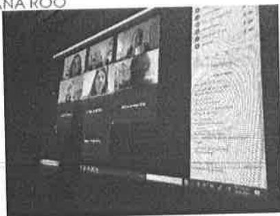
20/01/2021 Reunión interinstitucional para definir temas prioritarios, entre ellos el plan de campaña.