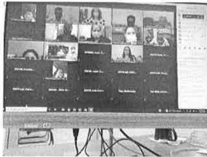
12/01/2022 Reunión con SEFIPLAN para elaboración de programas y presupuestos con perspectiva de género.

En este trimestre en coordinación con el IQM y la SEFIPLAN, se ha impulsado el cumplimiento de los indicadores plasmados en el Programa PASEVCM, lo que ha determinado el ejercicio de acciones por las instancias para contemplar presupuestos con perspectiva de equidad de género.