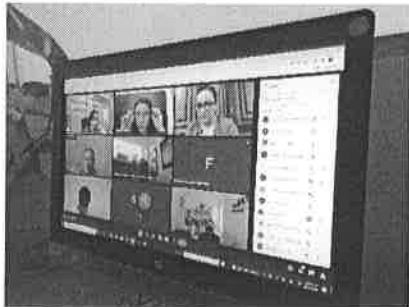
07/01/2022 Reunión de avances y para exposición en mesas con el gobernador.