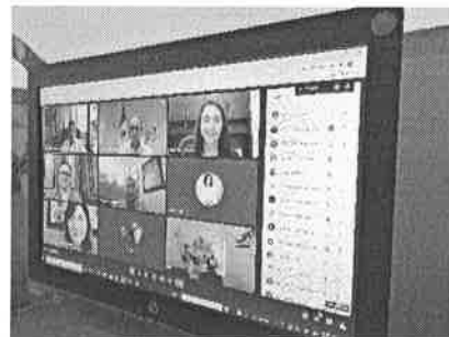
07/01/2022 Reunión de avances y para exposición en mesas con el gobernador.