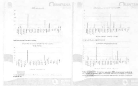
05/07/2022 Oficio para registro de avances en el SIPASEVCM de áreas internas de la SEGOB.