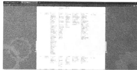
20/11/2022 Evidencia de registro de actividades en el sistema informático SIPASEVCM.