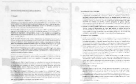
05/07/2022 Oficio para registro de avances en el SIPASEVCM de áreas internas de la SEGOB.

Se realizó la verificación en el sistema informático de los avances registrados por las instituciones como parte del Programa PASEVCM, asimismo, se realizó un análisis de la información ingresada y con ello tener un diagnóstico de los registros.