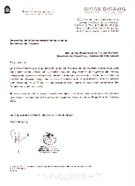
05/07/2022 Oficio para registro de avances en el SIPASEVCM de áreas internas de la SEGOB.

De manera interna se participa con las unidades administrativas que cuentan con actividades que abonen al Programa Integral Anual del PASEVCM con el fin de coordinar el seguimiento de las acciones reportadas en el sistema informático SIPASEVCM.