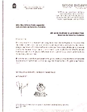
05/07/2022 Oficio para registro de avances en el SIPASEVCM de áreas internas de la SEGOB.