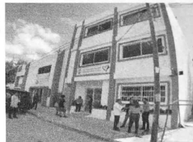
07/11/2022 Presencia de la DIGAVIG en la inauguración del edificio de las Fiscalías Especializadas como Anexo del Centro de Justicia para las Mujeres.