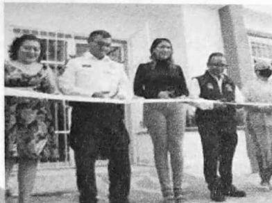
07/11/2022 Presencia de la DIGAVIG en la inauguración del edificio de las Fiscalías Especializadas como Anexo del Centro de Justicia para las Mujeres.

En el periodo se verificó la ampliación del centro de justicia para las mujeres en la zona norte del estado, en coordinación con la fiscalía del estado y de las diversas instituciones que participan en el otorgamiento de servicios a las mujeres, también se verificó por medio de los informes de cumplimiento de la alerta de violencia de género el funcionamiento de módulos en los ayuntamientos.