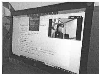
23/03/2022 Reunión con presidenta municipal de Cozumel para impulsar construcción de Centro de Justicia.