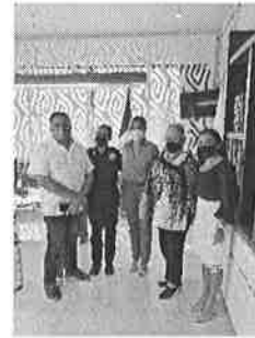
27/01/2022 Reunión con presidenta municipal de Solidaridad informando la coordinación con fiscalía para la construcción de CJM.