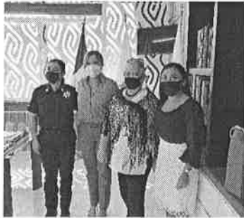
27/01/2022 Reunión con presidenta municipal de Solidaridad informando la coordinación con fiscalía para la construcción de CJM.

Se han mantenido reuniones con autoridades municipales y con la Fiscalía con el fin de impulsar la construcción del Centro de Justicia, en el caso de Solidaridad ya se cuenta con un gran avance para lograr su edificación en 2022, mientras que, en el municipio de Cozumel, se orienta la manera de proyectar el edificio.