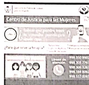
23/08/2022 Verificación de funcionamiento de Centro de Justicia en Benito Juárez.