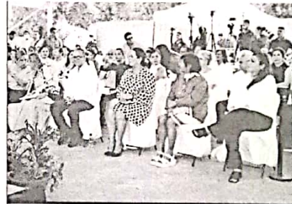
22/09/2022 Evento de verificación de inicio de obra en Solidaridad.