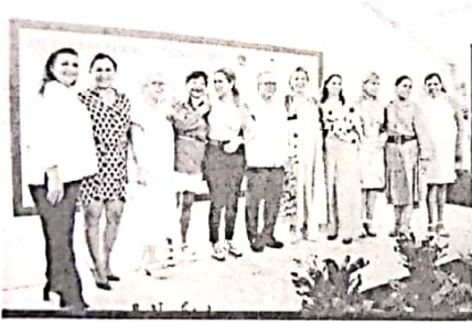
22/09/2022 Evento de verificación de inicio de obra en Solidaridad.

Se han mantenido reuniones con autoridades municipales y con la Fiscalía con el fin de impulsar la construcción del Centro de Justicia, en el caso de Solidaridad ya se cuenta con un gran avance para lograr su edificación en 2022, mientras que, en el municipio de Cozumel, se orienta la manera de proyectar el edificio.