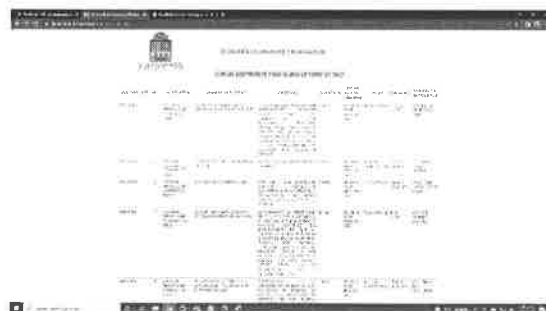
15/01/2022 Evidencia portal de Servicio profesional de carrera.