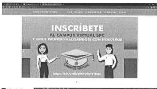
15/03/2022 Evidencia portal de Servicio profesional de carrera.