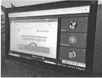
30/11/2021 Sesión comisión de seguimiento y evaluación.

seguimiento, también se participa en las comisiones de prevención, erradicación y atención del sistema antes mencionado.