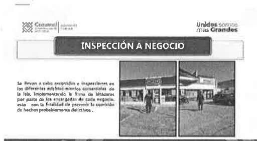
10/11/2021 Verificación de evidencia de acciones de verificación de venta de bebidas alcohólicas en Cozumel.

Se realiza la verificación de la evidencia proporcionada por ayuntamientos respecto a las acciones de supervisión en el establecimiento de venta de bebidas alcohólicas como parte de los patrullajes preventivos, asimismo se capacita a las personas pertenecientes a corporativos policiales que actúen como primeros respondientes.