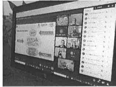
09/11/2021 Reunión con organismos estatales para dar seguimiento a acciones de prevención y atención de la violencia contra las mujeres.

Como resultado de estas reuniones se han realizado diversas estrategias por parte de los organismos estatales para generar una cultura de igualdad de Género, como son atenciones a la ciudadanía por las dependencias responsables, el seguimiento a estrategias implementadas por las mismas.