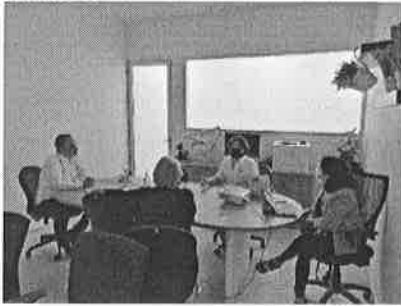
08/11/2021 Reunión con titular de la Fiscalía General de Estado para implementar estrategias de atención de la AVGM.