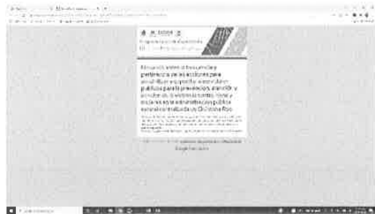
16/11/2021 Introducción a encuesta de necesidades de capacitación PUC.