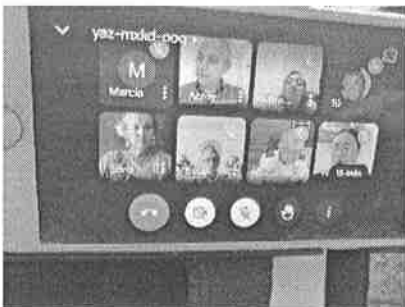
01/11/2021 Reunión de Gobernador con dependencias del ejecutivo.