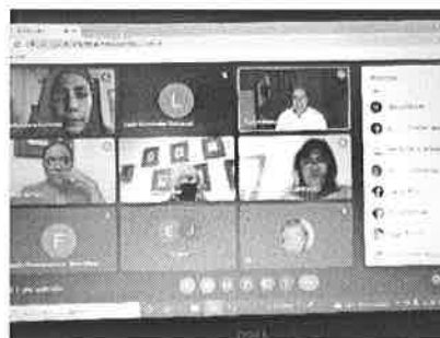
19/11/2021 Reunión interinstitucional con dependencias del ejecutivo estatal, seguimiento de acciones.