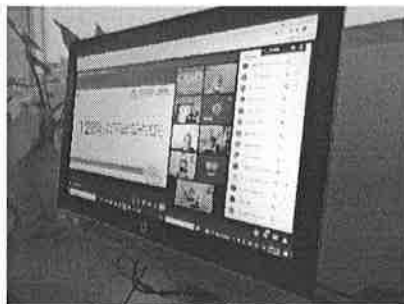
09/11/2021 Reunión ordinaria del sistema PASEVCM.

La comisión de evaluación y seguimiento se encuentra activa y con ello se realiza la metodología para verificar las actividades que cada dependencia realiza para prevenir, atender, sancionar y erradicar la violencia contra las mujeres, asimismo, actualmente se alimenta el Sistema Informático del PASE, por parte de la DIGAVIG, además de acordar internamente el seguimiento por parte de la dirección de las acciones que como SEGOB se realicen.