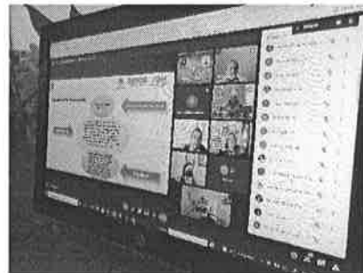
09/11/2021 Sesión PASEVCM.