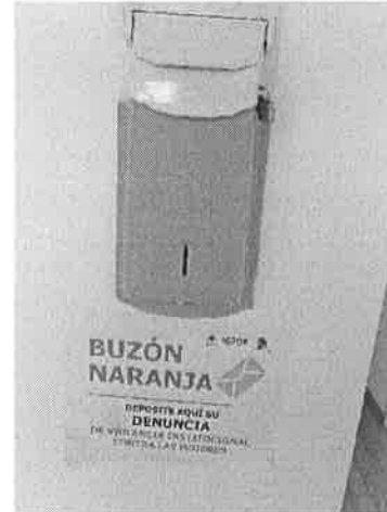
Buzón naranja instalado en oficinas de SEGOB.

Con estas acciones impulsa una cultura de la no violencia contra las mujeres al interior de la institución, así como entre las instituciones que se encuentran instaladas en las oficinas de Plaza Hollywood, constantemente se verifica la existencia de alguna queja o denuncia para dar seguimiento, sin embargo, a la fecha no se ha presentado ninguna.