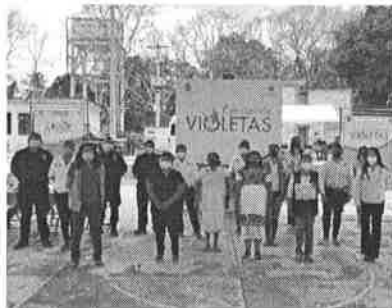
05/11/2021 Evidencia de la SSP de atención en módulos "Puerta Violeta", mediante informe de cumplimiento.