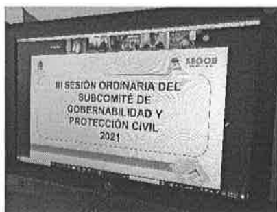
24/11/2021 Sesión del subcomité de gobernabilidad y protección civil.

Se participo en las reuniones con instituciones responsables de generar la programación y presupuestación con perspectiva de equidad de género en cada una de las dependencias que cuentan con atención a las mujeres y en general a través de los programas presupuestarios de las unidades administrativas.