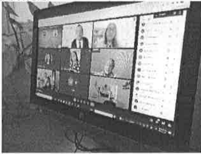
09/11/2021 Reunión con organismos estatales para dar seguimiento a acciones de prevención y atención de la violencia contra las mujeres.