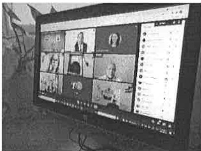
09/11/2021 Reunión ordinaria del sistema PASEVCM.