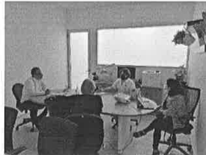
08/11/2021 Reunión con titular de la Fiscalía General de Estado para implementar estrategias de atención de la AVGM.