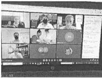
30/11/2021 Sesión de las comisiones de prevención y atención.