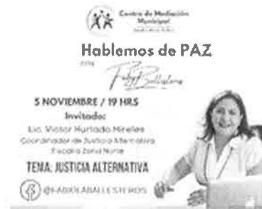
05/11/202 Verificación de campañas en el municipio de Solidaridad.

Con estas actividades se verifica la implementación de campañas en el marco de la prevención de la violencia de género en los municipios, mismos que cuentan con la orientación del plan a