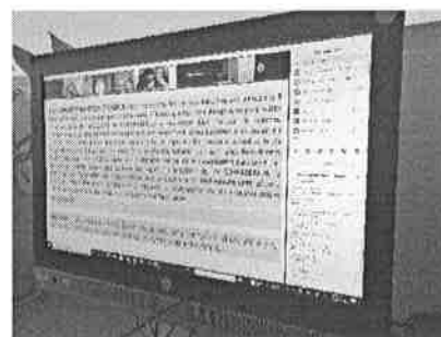
24/11/2021 Sesión del subcomité de gobernabilidad y protección civil.