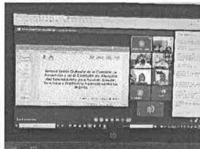
30/11/2021 Sesión de las comisiones de prevención y atención.