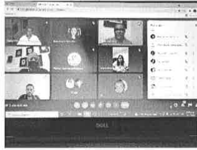
19/11/2021 Reunión de avances y para exposición en mesas con el gobernador.

Con la adecuación programática – presupuestal en uno de los componentes de la Dirección General, se ha logrado ejercer recurso que contribuye a una de las medidas contempladas en la AVGM, asimismo las dependencias y la unidad han alineado la programación con perspectiva de género, además, con la participación en las mesas de trabajo periódicas, se ha expuesto la necesidad de que las instituciones cuenten con presupuestos que atiendan la problemática.