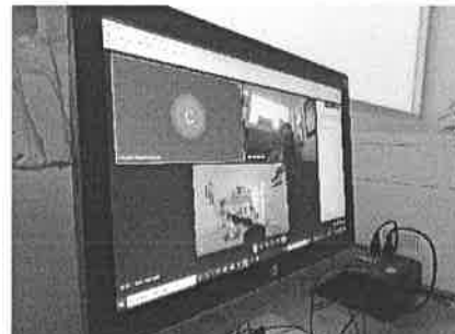
08/12/2021 Reunión interna SEGOB para definir comisiones PASEVCM.

El resultado de las reuniones es el seguimiento del sistema PASEVM estatal, asimismo se ha integrado el programa estatal del sistema, implementando las comisiones de seguimiento de cada uno de los temas que trata el mismo, internamente se ha dado seguimiento a la manera de verificar las acciones que se realizan para atender el programa por parte de la Secretaría.