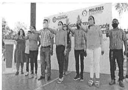
25/11/202 Verificación de campañas en el municipio de Solidaridad.