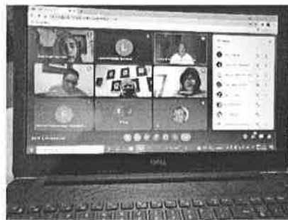
19/11/2021 Reunión de Gobernador con dependencias del ejecutivo.