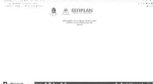
04/11/2021 Evidencia de elaboración de encuesta.

Como resultado de la generación de encuestas, el organismo responsable de la ejecución del proyecto del Programa Único de Capacitación, ha generado un diagnóstico, el cual cimienta los temas que se propongan para nutrir la matrícula para el funcionariado público.