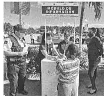
05/11/2021 Evidencia de la SSP de atención en módulos "GEAVIG", mediante informe de cumplimiento.