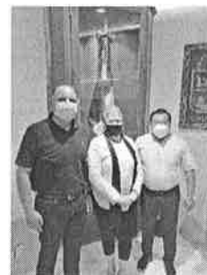
24/11/2021 Reunión con presidente municipal de Tulum.

En las reuniones con los titulares de las instituciones responsables de la vigilancia y cumplimiento de la normativa, se ha informado la necesidad de contar con acciones preventivas, dentro de las que se impulsan por esta dirección es la verificación del cumplimiento del reglamento de bebidas alcohólicas, sobre todo en los horarios establecidos, esto como parte de las medidas de la AVGM.