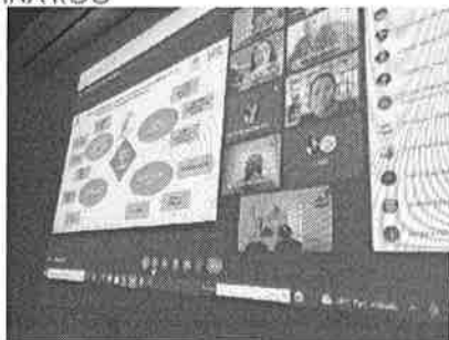
05/11/2021 Presentación de programa de capacitación como estrategia de implementación de la SEQ.