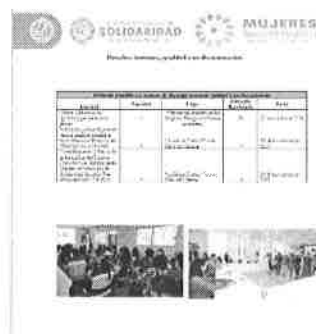
Ejemplo de informe de capacitación del municipio de Solidaridad.

Con la capacitación al funcionariado público y con la participación de diversas áreas municipales se ha promovido la participación de las mujeres en cursos y talleres laborales y de sensibilización, además a través del informe del mecanismo AVGM se concentra la información que se genera en los mismos, un logro a nivel estatal es la incorporación de un programa piloto en educación media superior.