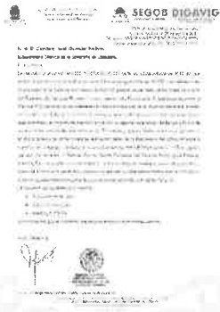
30/10/2021 Oficio de envío de acciones en cumplimiento del PASEVCM.

En este trimestre en coordinación con el IQM y la SEFIPLAN, se ha impulsado el cumplimiento de los indicadores plasmados en el Programa PASEVCM, lo que ha determinado las adecuaciones programático – presupuestales para el ejercicio 2022 sobre todo en las dependencias que atienden violencia de género.