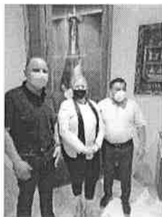
24/11/2021 Reunión con presidente municipal de Tulum.