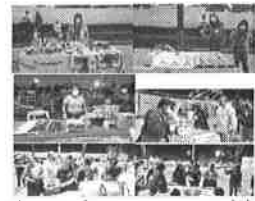
11/2021 Evidencia de capacitación del municipio de Cozumel.