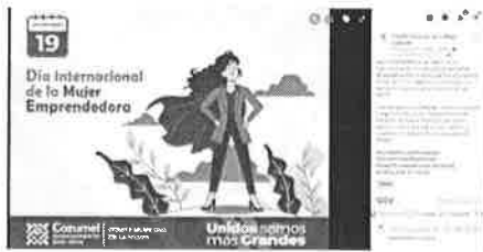
25/11/202 Verificación de campañas en el municipio de Cozumel.