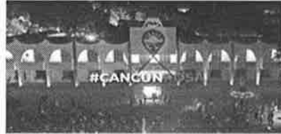
08/10/202 Verificación de campañas en el municipio de Benito Juárez.