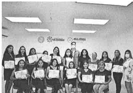
11/2021 Evidencia de capacitación del municipio de Solidaridad.