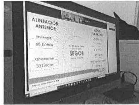
08/10/2021 Reunión con la subsecretaría técnica para alinear programas presupuestales a PASEVCM.

Como resultado de las acciones realizadas por la Dirección General, se ajustó la estructura programática, lo cual adecuó lo presupuestal de la unidad administrativa, contemplando perspectiva de género, asimismo en coordinación con la Subsecretaría Técnica se vinculó a diferentes áreas la programación de acciones dentro de la Secretaría para que se contemple la perspectiva de género alineado al PASEVCM.