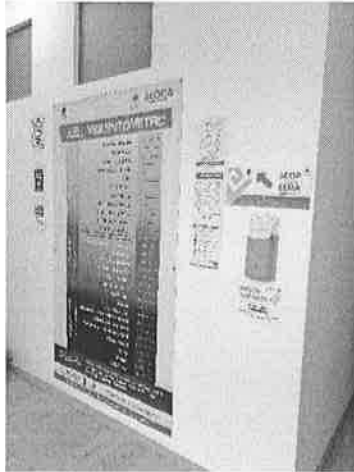
Violentómetro y buzón naranja.

En el cuarto trimestre de 2021, se ha verificado el buzón de denuncia por quejas y hostigamiento sin tener ninguna denuncia al respecto, además se conmemora con el personal de la Dirección los días 25 de cada mes el "Día Naranja" en rechazo a la violencia contra las mujeres.