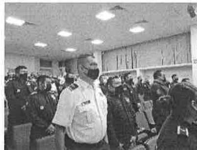
16/11/2021 Capacitación a personas integrantes de corporativos policiales como primer respondiente.

Como resultado de las acciones descritas, se verifica el cumplimiento del Reglamento de venta de bebidas alcohólicas en las zonas con mayores índices de violencia familiar, asimismo, se capacitó a las personas policías para actuar como primeros respondientes en casos de violencia de cualquier tipo.