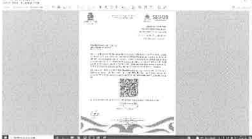
04/11/2021 Oficio para invitación a contestar encuesta de capacitación PUC (SEGOB).