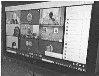
09/11/2021 Sesión PASEVCM.

El Sistema Estatal para Prevenir, Atender, Sancionar y Erradicar la Violencia contra las Mujeres, es el mecanismo por el las dependencias del gobierno del estado inciden en acciones para la disminución de la violencia contra las mujeres, en este periodo se actualizó el programa que da sustento al sistema, asimismo se realizaron sesiones ordinarias y extraordinarias del mismo y de sus comisiones.