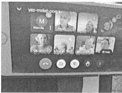
01/11/2021 Reunión interinstitucional con dependencias del ejecutivo estatal para vinculación de estrategias.

Dentro de las actividades que se realizan para atender las medidas y las conclusiones del mecanismo de Alerta de Violencia de Género, se ha participado diversas reuniones con las dependencias del ejecutivo involucradas en la generación de acciones para promover una cultura de igualdad de género y no violencia contra las mujeres en el Estado, en estas reuniones se da seguimiento a los casos de violencia que se presentan en el Estado, funcionando como un monitor de atenciones.