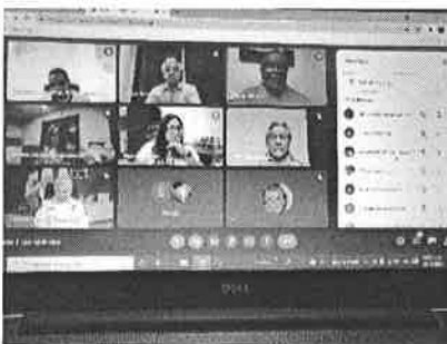
19/11/2021 Reunión interinstitucional con dependencias del ejecutivo estatal, seguimiento de acciones.