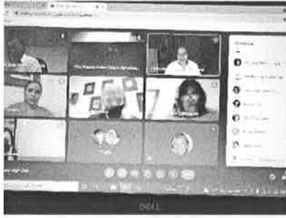
19/11/2021 Reunión de avances y para exposición en mesas con el gobernador.