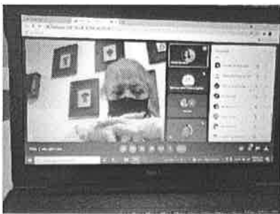
19/11/2021 Reunión de Gobernador con dependencias del ejecutivo.

Se han tenido reuniones con las dependencias encargas de difundir las acciones que se realizan para prevenir y atender la violencia contra las mujeres, se participa de manera permanente en las mesas de cumplimiento de acciones por parte del gobernador.