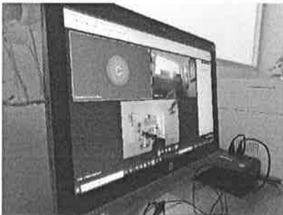
08/12/2021 Reunión interna SEGOB para definir comisiones PASEVCM.