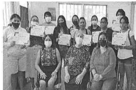
11/2021 Evidencia de capacitación del municipio de Solidaridad.

Con el impulso de la Dirección en coordinación con los ayuntamientos, se ha logrado realizar capacitaciones preventivas, de sensibilización, laborales y de empoderamiento dirigidas a mujeres.