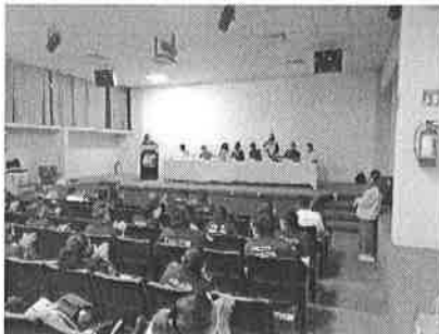
16/11/2021 Capacitación a personas integrantes de corporativos policiales como primer respondiente.