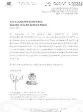
11/10/2021 Oficio de adecuación programática presupuestal para implementar recurso de la AVGM.