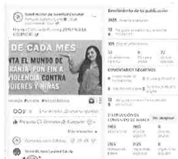
25/11/202 Verificación de campañas en el municipio de Cozumel.