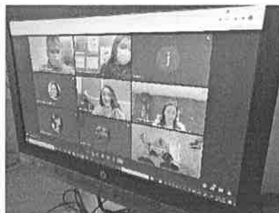
05/11/2021 Presentación de programa de capacitación como estrategia de implementación de la SEQ.