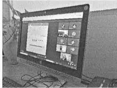
30/11/2021 Sesión comisión de seguimiento y evaluación.