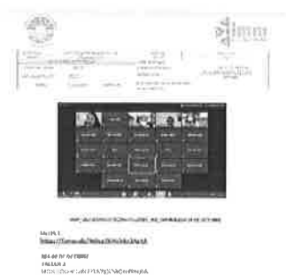
Ejemplo de informe de capacitación del municipio de Benito Juárez.