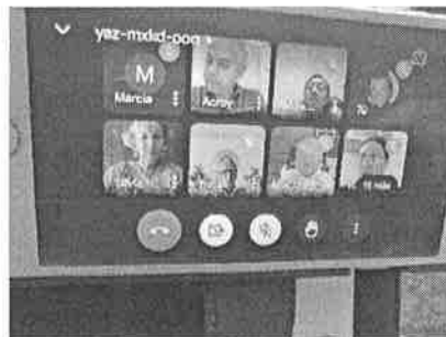
01/11/2021 Reunión de Gobernador con dependencias del ejecutivo.