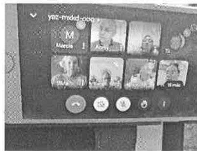
01/11/2021 Reunión interinstitucional con dependencias del ejecutivo estatal para vinculación de estrategias.