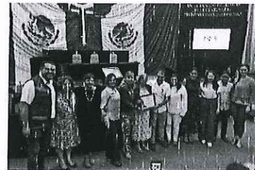
Conferencia Magistral "La Educación Sexual, un derecho de niñas y mujeres" 4-dic-2023