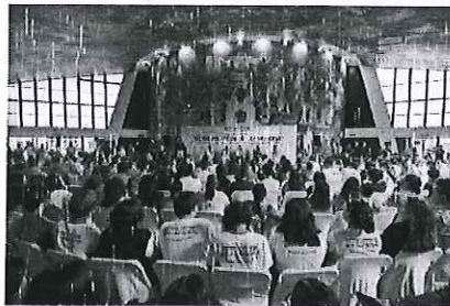
Conversatorio "Retos políticos de las mujeres" 16-oct-2023