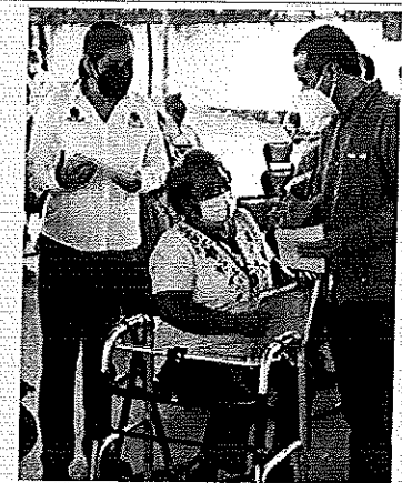
Audiencia No. 38 en Felipe Carrillo Puerto