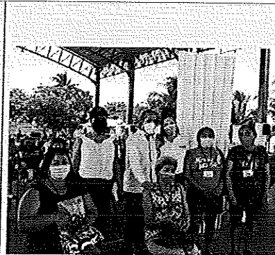
Audiencia No. 37 en Isla Mujeres