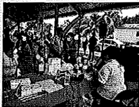
X Hazil Sur