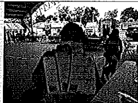
X Hazil Sur