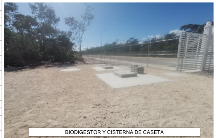
BIODIGESTOR Y CISTERNA DE CASETA