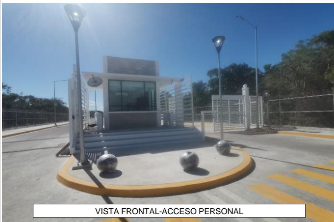
VISTA FRONTAL-ACCESO PERSONAL