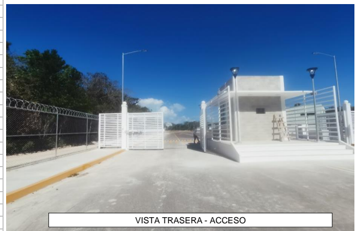
VISTA TRASERA - ACCESO