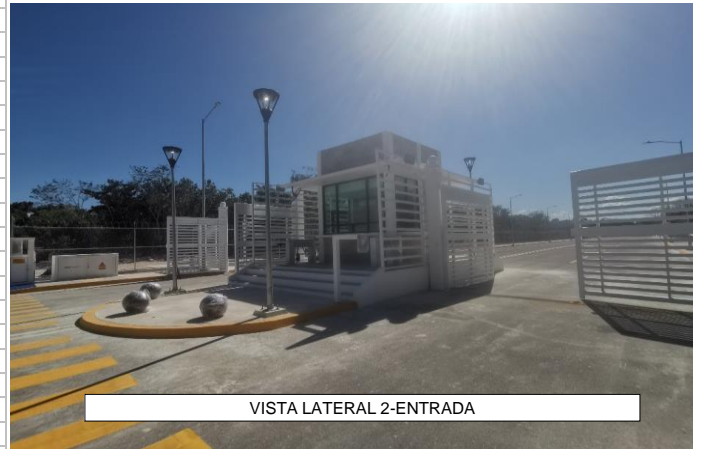
VISTA LATERAL 2-ENTRADA