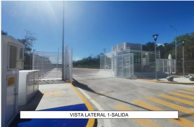
VISTA LATERAL 1-SALIDA