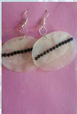
Aretes elaborado escama de pescado natural con incrustación de piedras