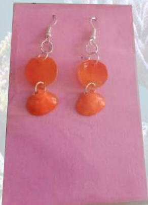
Aretes elaborados en escama de pescado natural y concha