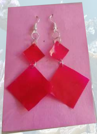
Aretes elaborados con escamas de pescado rosa