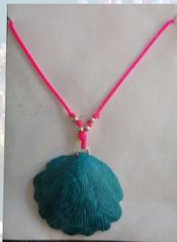
Collar elaborado en concha color azul