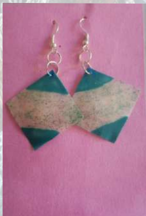
Aretes bicolor elaborados con escamas de pescado azul con brillos