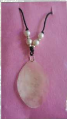
Collar de escama elaborado en escama natural de pescado con piedras blancas