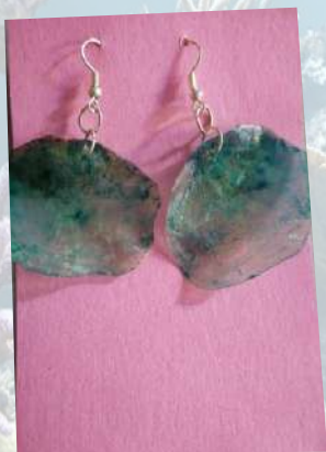
Aretes elaborados con escamas de pescado color verde aguamarina