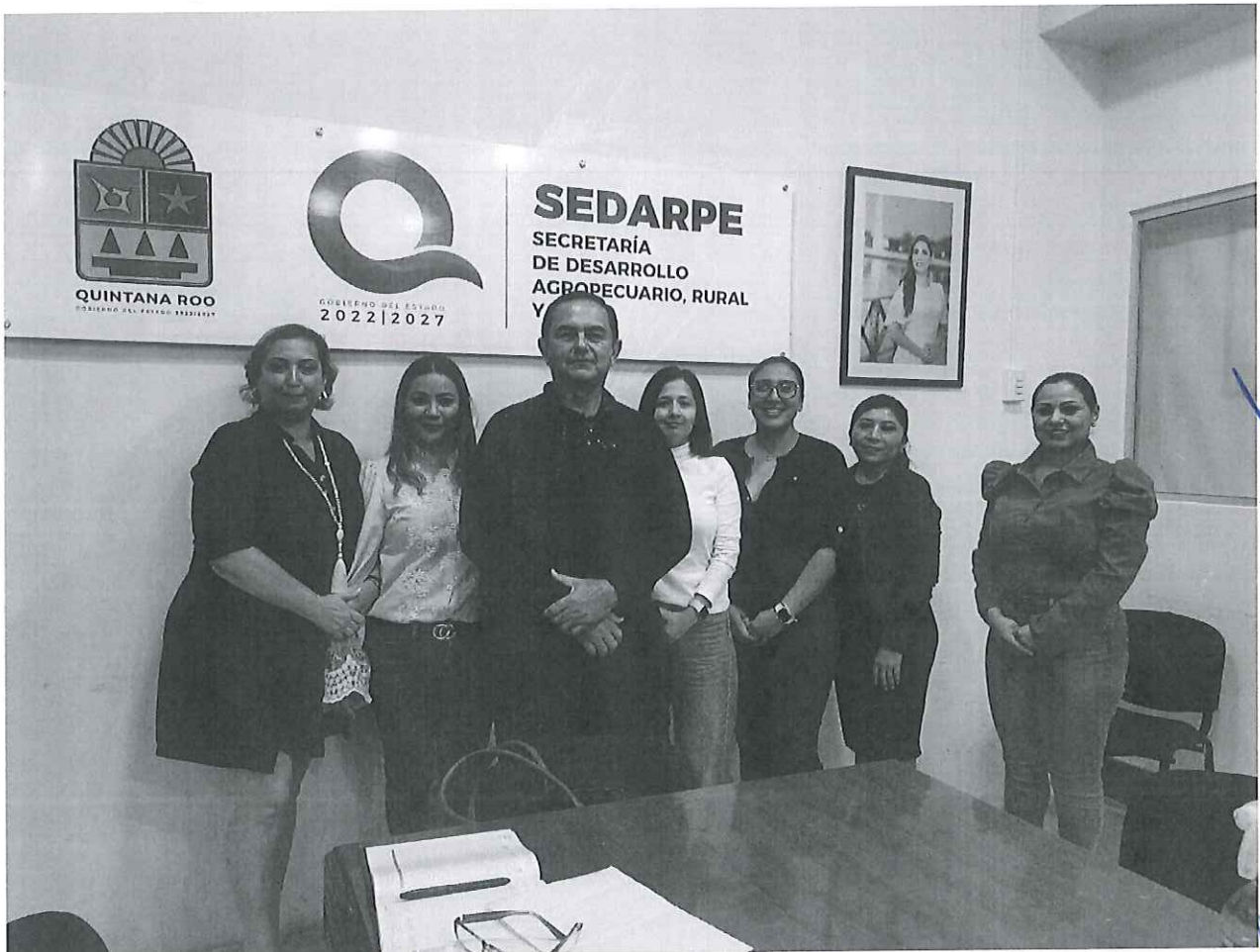
Fotografía oficial del Primera Sesión Extraordinaria del Comité de Ética y de Prevención de Conflictos de Interés (COEPCI), de la Secretaría de Desarrollo Agropecuario, Rural y Pesca