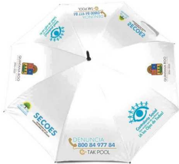
FRENTE / SUPERIOR