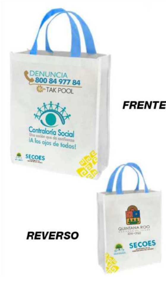
Mochila tipo morral con imagen institucional