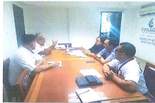
Comisión Nacional del Agua (CONAGUA).