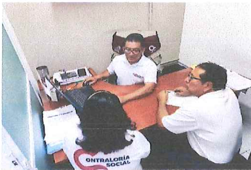
Servicio Estatal del Empleo y Capacitación para el trabajo (SEECAT).