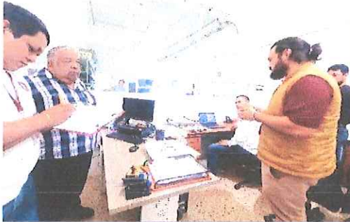
Registro Público de la Propiedad y el Comercio (RPPC).