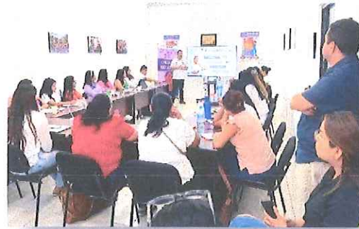
Instituto Quintanarroense de la Mujer (IQM).