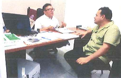
Instituto Quintanarroense de la Juventud (IQJ).