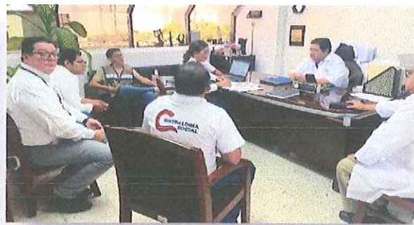
Hospital Materno Infantil Morelos (HMIM).