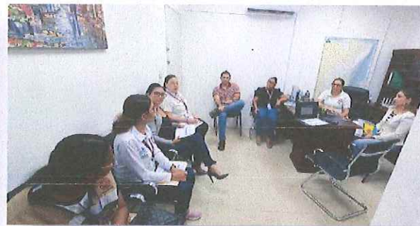
Dirección General del Instituto de Movilidad del Estado de Quintana Roo (IMOVEQROO).