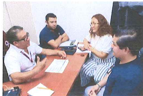
Servicios Educativos de Quintana Roo (SEQ).