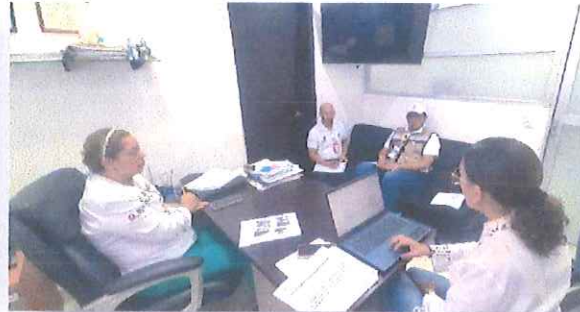
Hospital General de Chetumal (HGC).