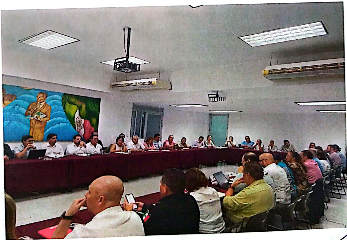
Imagen 6. Reunión de Gabinete Legal y Ampliado, participación de todos los integrantes

La importancia de transitar de un modelo de seguimiento por Ejes a Sectorial, se debe a la homologación de esfuerzos institucionales como el COPLADE, el cual permite el esquema piramidal dentro de la estructura gubernamental al interior de cada sector, como al interior del gabinete en su conjunto; facilita el trabajo institucional de seguimiento al PED, y de sus programas, al empalmar el trabajo de los subcomités sectoriales del COPLADE y la Coordinación Técnica a fin de evitar la triangulación de información y duplicidad de reportes; propicia una mayor integración, socialización y difusión de acciones al interior de los sectores dando pauta a fortalecer y priorizar iniciativas, y por último, los sectores tienen mayor manejo y seguimiento a los compromisos prioritarios de la titular del Poder Ejecutivo.