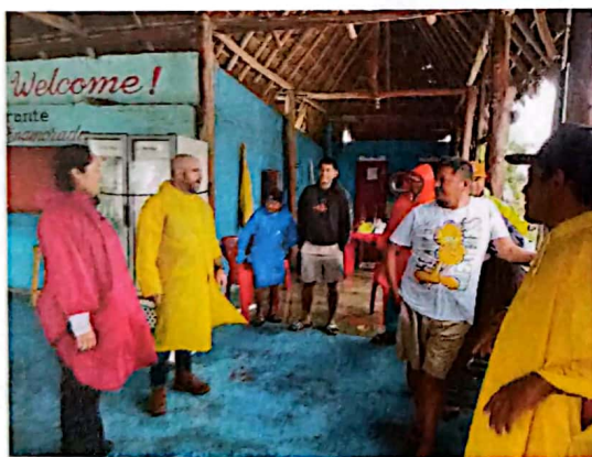
Imagen 13. Recorridos en la Isla de Holbox, municipio de Lázaro Cárdenas.