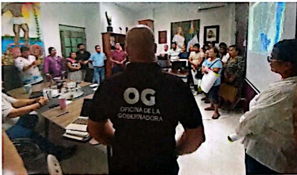
Imagen 2. Atención a la ciudadanía afectada por las inundaciones, en el municipio de Bacalar.

Los resultados obtenidos de esta acción nos permitieron escuchar de forma directa a la ciudadanía, así como exponerles la naturaleza y ubicación de sus predios es zona inundable, también se les brindó apoyo de CAPA-Bacalar para la extracción del agua por medio de bombas de achique, de igual modo, las condiciones climáticas soleadas en el estado contribuyeron a minimizar la cantidad de agua en la zona inundada. Sin embargo, la temporada de lluvias continua, por lo que se estará atento al monitoreo y posibles riesgos a la población por parte de las autoridades locales.