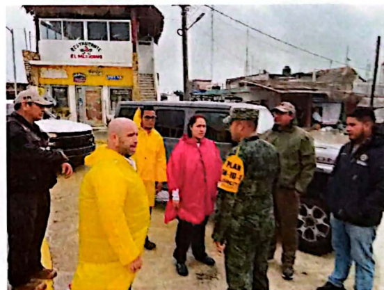
Imagen 14. Supervisión de acciones en el municipio de Lázaro Cárdenas