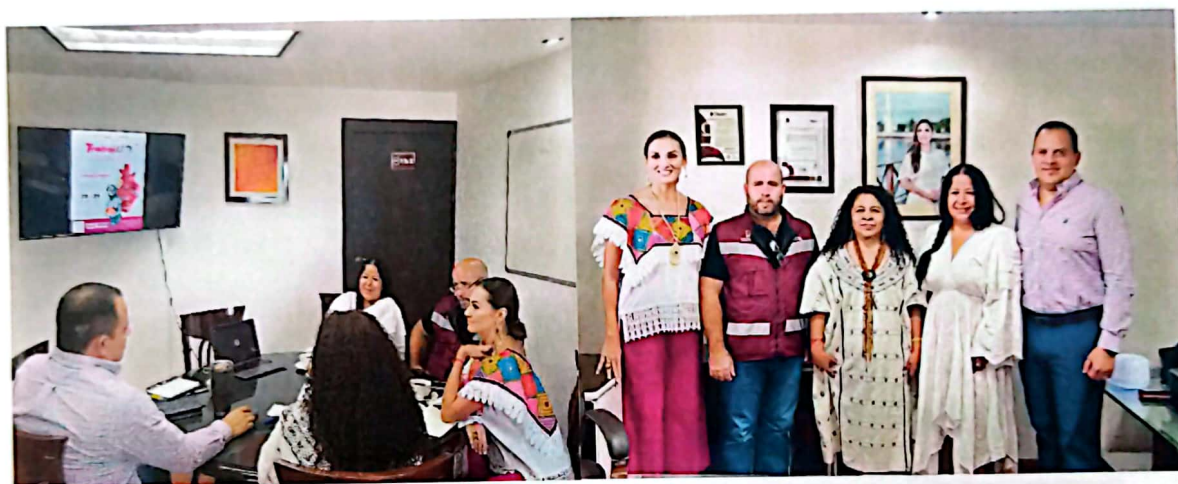
Imagen 10. Reunión de trabajo y colaboración con la Secretaria del Trabajo del Estado de Oaxaca.

La coordinación entre los diferentes órganos y niveles de gobierno es indispensable para lograr eficiencia en el diseño e implementación de políticas públicas. En tal sentido y como parte de las acciones realizadas en el mes de septiembre, se llevó a cabo una reunión de trabajo con la Secretaría del Trabajo del Estado de Oaxaca, la Secretaría del Trabajo del Estado de Q. Roo, Instituto de la Cultura y las Artes del Estado de Q. Roo y el Instituto de Economía Social y Solidaria del Estado de Q. Roo (Imagen 10), a fin de socializar e impulsar el intercambio cultural entre los estados, tomando en cuenta el programa Trabajarte (vinculación entre el trabajo artesanal con el fomento al empleo, capacitación y fomento a las cadenas de valor). También, como parte de las iniciativas expuestas en la reunión se propuso el intercambio de maestros artesanos oaxaqueños a Quintana Roo, para capacitar en nuevas técnicas y materiales artesanales, un intercambio de ideas y saberes, en donde se estará trabajando en la acciones que den viabilidad a dicha iniciativa.