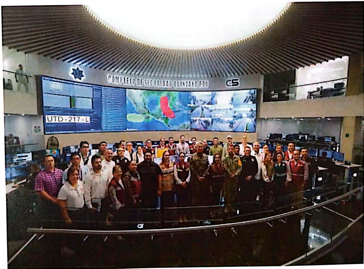
Imagen 11. Reunión y Organización del Centro de Mando con autoridades municipales, estatales y federales.

La coordinación interinstitucional es fundamental para determinar tiempos y medidas de prevención, atención y seguimiento de acciones ante un fenómeno hidrometeorológico. En el mes de septiembre, se presentó la Tormenta Tropical “Helene” con trayectoria de afectación por las rachas de vientos y lluvias torrenciales en el estado. En este sentido, la Oficina de la Gobernadora desempeñó un papel fundamental en la coordinación y organización de las dependencias estatales como representantes de cada centro de mando en los municipios (Imagen 11). También, se encargó de los reportes constantes de los municipios afectados por el fenómeno meteorológico, donde se informó de manera puntual el clima en tiempo real, se comunicó el estado de fuerza del municipio, se supervisó el estatus de los refugios y desazolves en las calles inundadas por las lluvias y apoyo a la ciudadanía. Cabe destacar que como parte de la organización instruida por la Gobernadora, la Oficina de la Gobernadora y la Secretaría de Obras Públicas brindaron especial atención a las afectaciones de la localidad de Chiquilá y la Isla de Holbox, en el municipio de Lázaro Cárdenas (Imagen 12, 13 y 14).