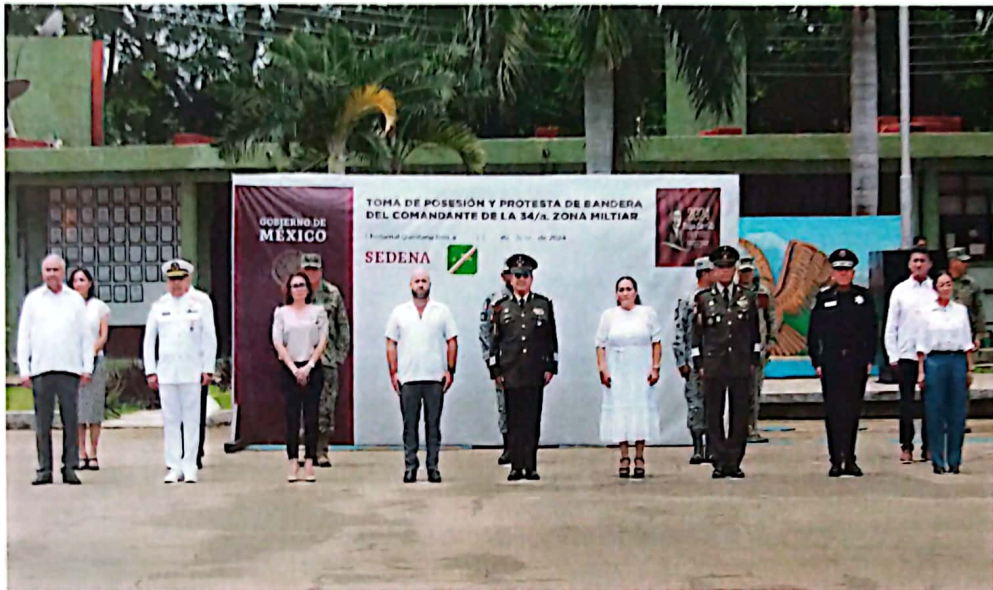
Imagen 4. Participación del Jefe de Oficina, como representante de la Gobernadora en evento protocolario.

La tercera acción se refiere a mantener la presencia del gobierno del estado en eventos públicos y privados, dado que permiten fortalecer los lazos de coordinación y fomentar valores cívicos. En el mes de julio se llevó la representación de la Gobernadora en dos ceremonias protocolarias; 1) Toma de posesión y protesta de bandera del comandante de la 34/a zona militar, donde asistieron 15 ejecutivos que conformaron el presidium (Imagen 4); 2) Día Internacional del Combatiente de Incendios Forestales, donde se entregaron reconocimientos a los combatientes de incendios forestales, por contribuir a la preservación, protección y conservación de la selva maya de Quintana Roo (Imagen 5).