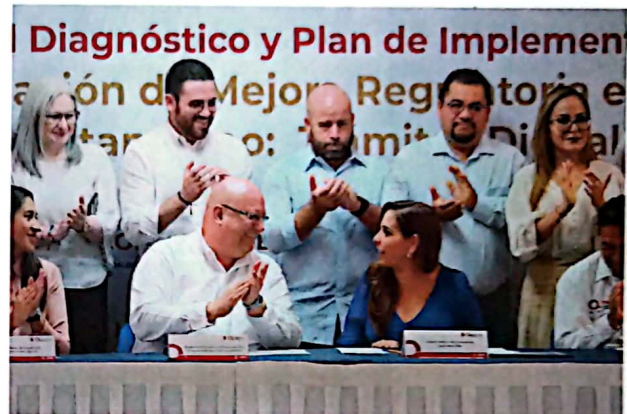
Imagen 8. Participación de la Ejecutiva Estatal a la presentación del Diagnóstico y Plan de Implementación de Mejora Regulatoria en el Estado (CEMER).