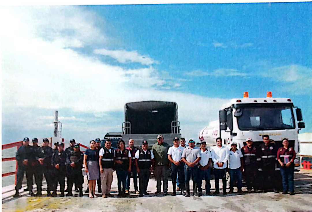
Imagen 12. Representación de los recursos humanos y equipo vehicular destinado al estado de fuerza en el municipio de Lázaro Cárdenas.