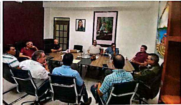
Imagen 3. Reuniones de trabajo con el Presidente Municipal de Bacalar para la atención de las zonas afectadas e inundadas.