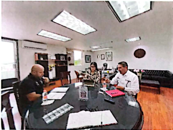
Imagen 7. Reunión de trabajo y coordinación con la Comisión de Mejora Regulatoria (CEMER).

El trabajo interinstitucional de la Oficina de la Gobernadora crea mecanismos de coordinación, inteligencia e intercambio de información; al respecto, en el mes de agosto se llevó a cabo una reunión con el titular de la Comisión de Mejora Regulatoria (CEMER, Imagen 7) con el propósito de impulsar la convocatoria y participación de los titulares del Gabinete Legal y Ampliado a la presentación de la Organización para la Cooperación y Desarrollo Económico (OCDE), el Diagnóstico y Plan de implementación de Mejora Regulatoria en el Estado de Quintana Roo; los resultados obtenidos fueron el 100 por ciento de la participación de los titulares del gabinete y la participación específica de la Ejecutiva Estatal; donde explicó que el plan de implementación contribuirá a la creación de la ventanilla digital de inversiones y permitirá impulsar la inversión y generación de empleos en beneficio de las familias quintanarroenses (Imagen 8 y 9).