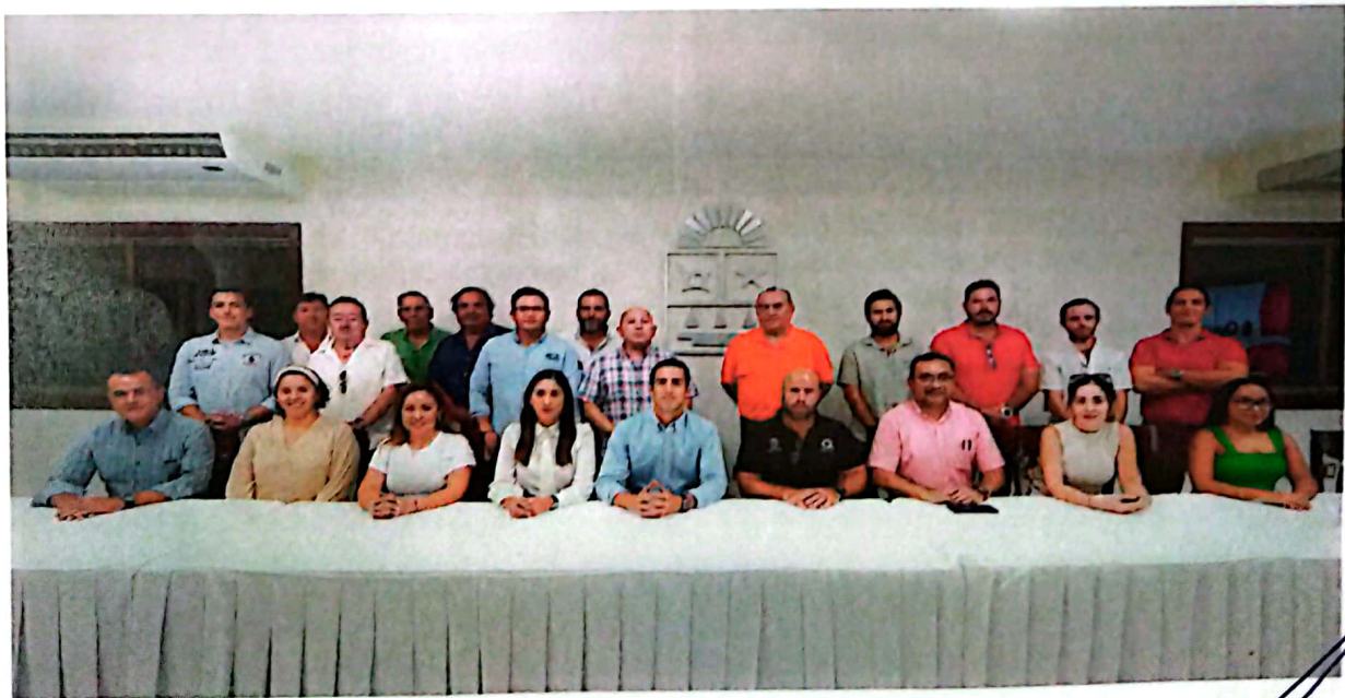
Imagen 1. Reunión Informativa del tema “Comercio Exterior”, participación de la OG, SEFIPLAN, SEDE, Empresarios y Agente Aduanero.

El Decreto de Región Fronteriza es del ámbito Federal y fue implementado para fomentar el desarrollo económico en las zonas fronterizas del país, incluyendo al estado de Quintana Roo; el cual contribuye a dinamizar la economía local y atraer empresas del sector turístico y comercial. También, durante la reunión se señalaron áreas de mejora y la necesidad de fortalecer la infraestructura logística y aduanera, además de la importancia de renovar el decreto fronterizo con algunas fracciones arancelarias.