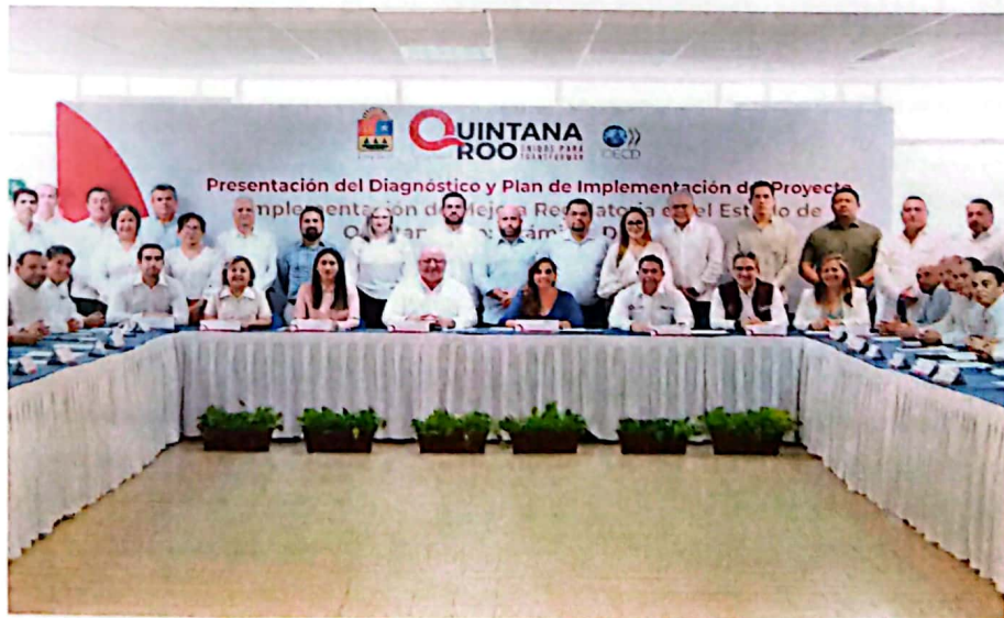
Imagen 9. Participación de los titulares del Gabinete Legal y Ampliado.