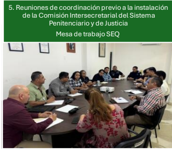
5. Reuniones de coordinación previo a la instalación de la Comisión Intersecretarial del Sistema Penitenciario y de Justicia Mesa de trabajo SEQ