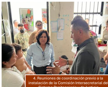
4. Reuniones de coordinación previo a la instalación de la Comisión Intersecretarial del Sistema Penitenciario y de Justicia Mesa de trabajo SESSEF-CEPSQROO