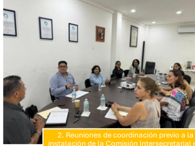
2. Reuniones de coordinación previo a la instalación de la Comisión Intersecretarial del Sistema Penitenciario y de Justicia Mesa de trabajo ICAT