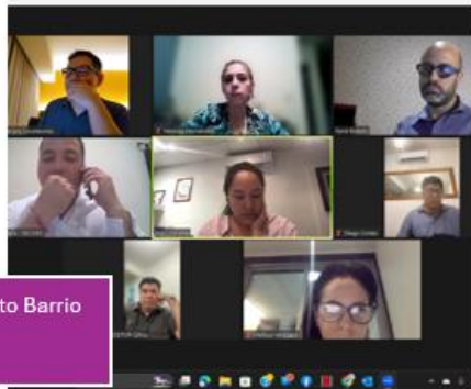
Reuniones de seguimiento Barrio Mágico Abril 2024