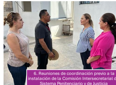
6. Reuniones de coordinación previo a la instalación de la Comisión Intersecretarial del Sistema Penitenciario y de Justicia Mesa de trabajo DIF