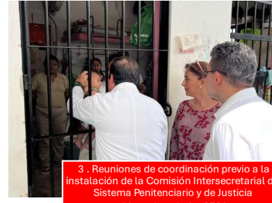
3. Reuniones de coordinación previo a la instalación de la Comisión Intersecretarial del Sistema Penitenciario y de Justicia Mesa de trabajo SESA