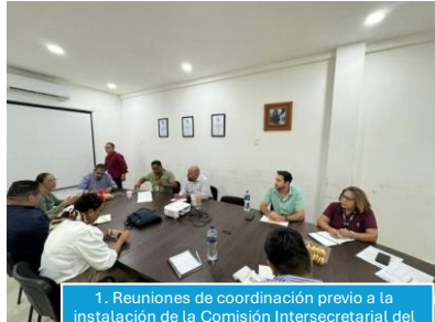
1. Reuniones de coordinación previo a la instalación de la Comisión Intersecretarial del Sistema Penitenciario y de Justicia Mesa de trabajo ICAT