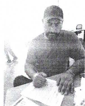
Descripción del gráfico 1:

Entrenadores de Alto Rendimiento realizando su trámite para pago de del mes de mayo.