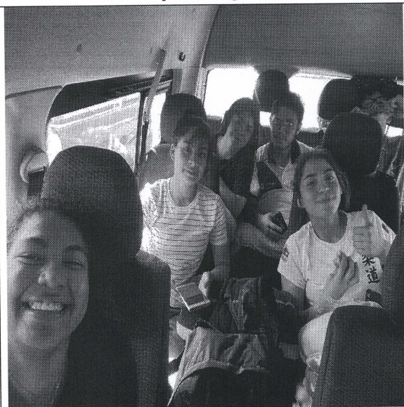
Descripción del gráfico 1:

Traslado Terrestre hacia el Tope de Deportivo; durante la realización del 1er Campamento de Preparación de Judo 2024, en Mérida, Yucatán.