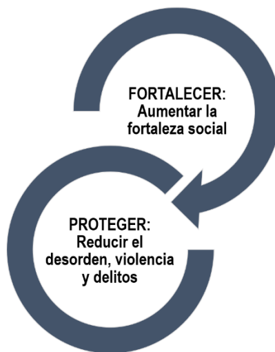
Ilustración 2. Acciones de la política de prevención: Proteger y Fortalecer.

El Modelo de Prevención Quintana Roo propone que, además de proteger a las personas, es necesario que la política de prevención desarrolle capacidades individuales y comunitarias, por medio de información y herramientas para desarrollar hábitos seguros, desalentar conductas de riesgo y aumentar su resistencia a involucrarse en actos violentos e ilegales.