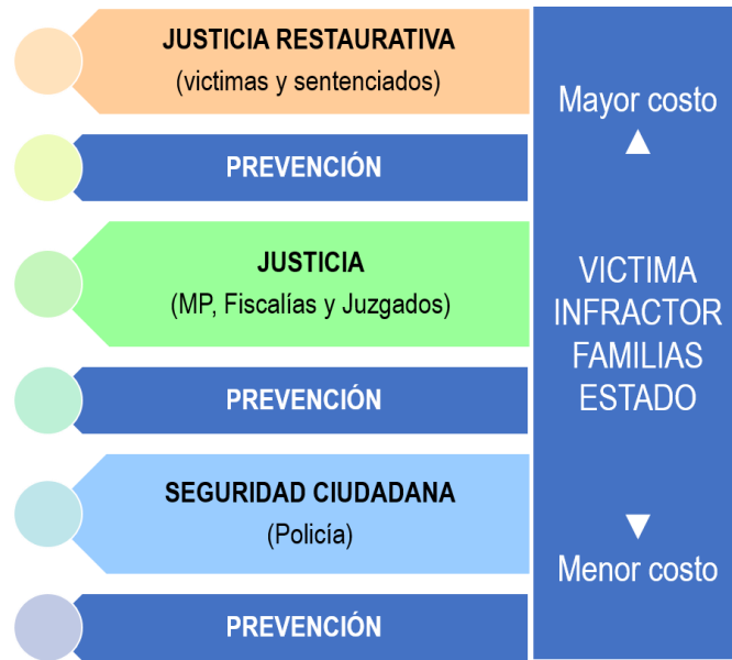
Ilustración 1. Edificio de seguridad-justicia-justicia restaurativa.